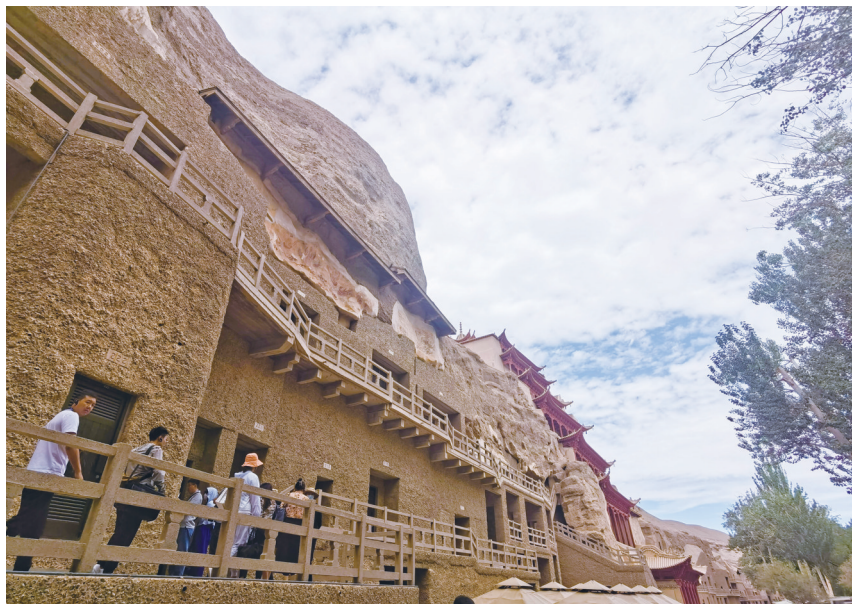
千年敦煌常看常新

曾经有人问:“洞窟里的壁画有的地方颜色没了,有的都变黑了,不补色吗?”“不补的,该什么样子就什么样子。”“那该如何让大家看到壁画在千百年前的样貌?”遇到类似问题,他们会告诉游客“不必担心”,敦煌研究院保护研究所专家通过多光谱分析技术,能科学准确地把肉眼已经看不到的画面还原再现,在不接触不造成壁画磨损的前提下,达到“补色”目的,让精美绝伦的壁画传世留影……“敦煌研究院特别注重对讲解员的培养,定期请科研、考古等