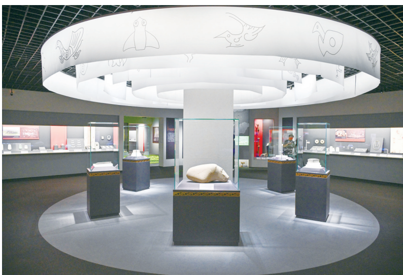
“实证中国:崧泽·良渚文明考古特展”展厅一角

千年石窟让我们一眼千年,尽阅中国古代精美绝伦的石窟艺术,思考如何传承传统文化。云冈研究院与有