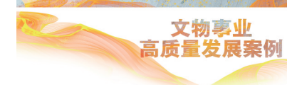
文物事业高质量发展案例

期待本次论坛相关议题获得与会各方的持续关注，进一步凝聚共识，汇聚各方智慧，共同助力石窟寺保护领域应对气候变化的挑战，引领石窟寺保护之路行稳致远。