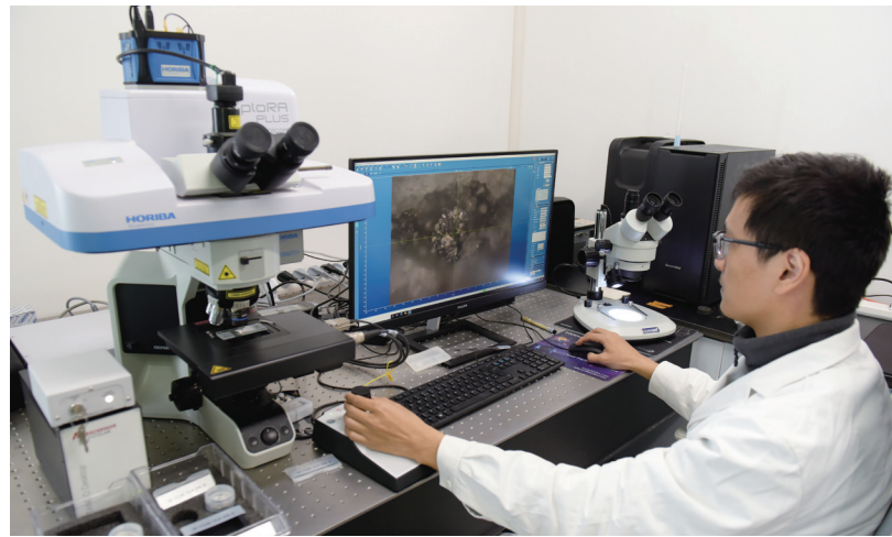
工作人员使用拉曼光谱仪进行标本检测