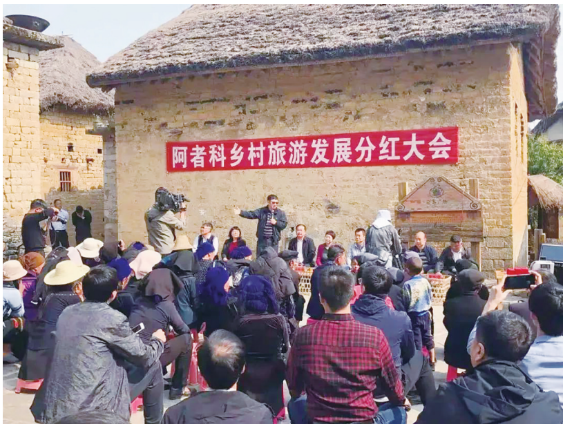
阿者科乡村旅游发展分红大会