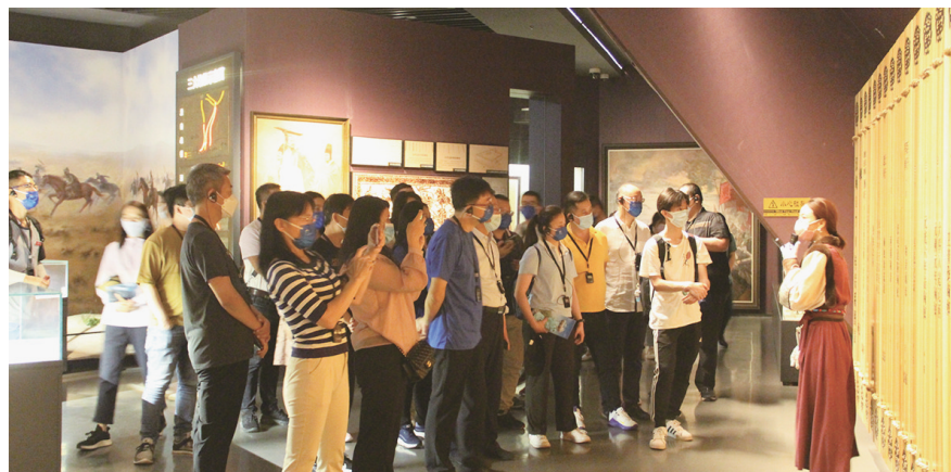
“在京台湾青年边疆行”交流参访团参观昭君博物院

奋斗新征程，建功新时代。淄博陶瓷琉璃博物馆，一座百姓喜爱的、有烟火气的博物馆，一座仍在成长中的博物馆，将继续以专业、活力、创新的姿态，讲好新时代陶琉文化故事。