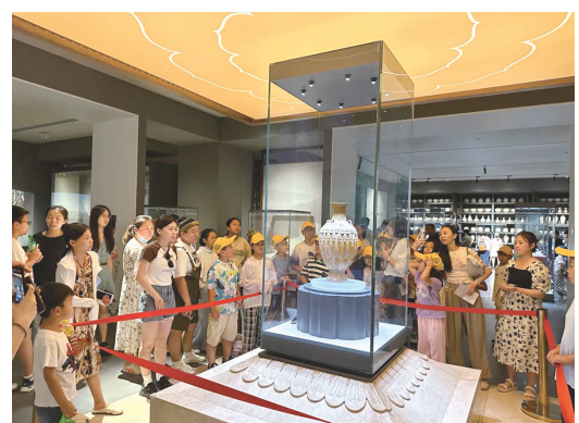
游客参观镇馆之宝“青釉莲花尊”

糕、糕点和纪念徽章，专门设计纪念邮戳和明信片，在游客中心设置主题邮局，提供旅游打卡服务，受到大学生游客的青睐。加强IP推广，举办联名活动，开展与华光国瓷及珀莱雅集团跨界合作，设计推出陶琉伴手礼、限量联名礼盒，通过文化赋能商业品牌引领年轻时尚新生活。目前，陶琉馆以陶瓷、琉璃产品为主体的文创涵盖了日用品、食品、文具、纪念章、饰品等门类超600多种，博物馆打卡、文创销售火爆，满足了游客吃、喝、游、乐、购多样化需求。