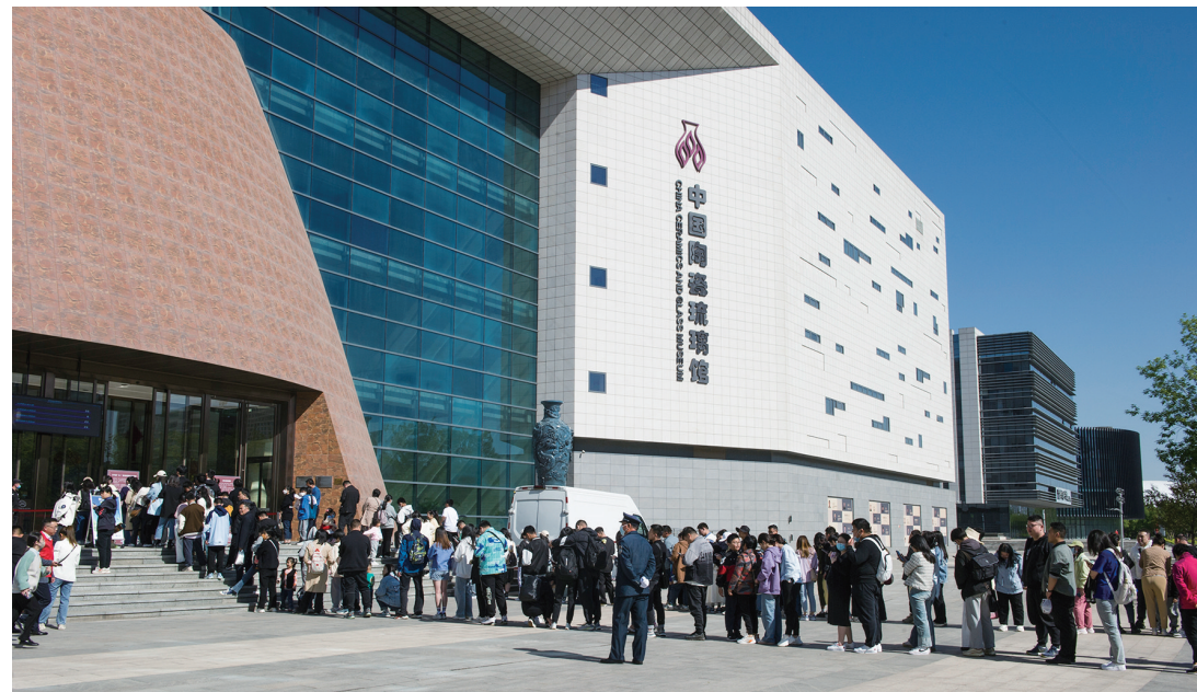
3月以来淄博陶琉馆游客数量激增

实施旅游业态创新提升行动，推出更有特色的文创产品。 结合博物馆景区特点，与合作单位加大文创产品开发力度，丰富其品类，满足游客对陶琉衍生品的需求。先后建成文创中心、打卡中心，开设“博物馆之城”文创大集，陆续推出文创雪