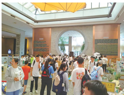
杭州工艺美术博物馆