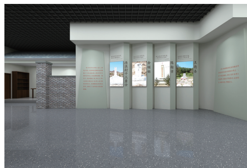
第二展区革命烈士纪念设施灯箱效果图