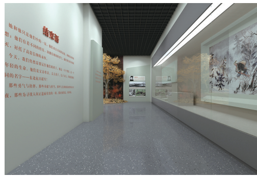
第六展区局部及尾厅效果图