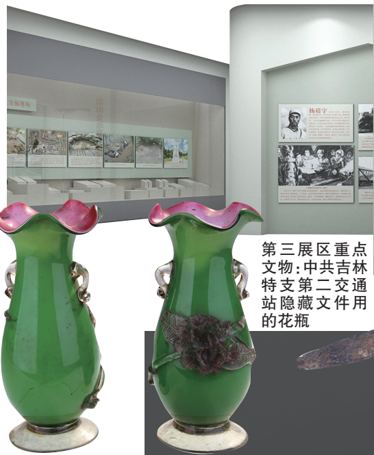
第三展区重点文物：中共吉林特支第二交通站隐藏文件用的花瓶

由吉林省博物院(东北抗日联军纪念馆)策划，并将推出“誓言如初——东北抗联故事专题展”，力求做到“政治性、思想性、艺术性”相统一，提升代入感、沉浸感、真实感，增强表现力、传播力、影响力，以“场景化呈现、故事化表达”的独特视角和新颖形式，再现那段可歌可泣的峥嵘岁月。