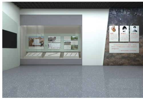
第四展区局部平面、文物及多媒体布局效果图