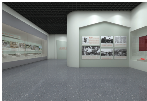
第一展区局部平面、重点文物及红石砬子考古挖掘版面及文物布局效果图