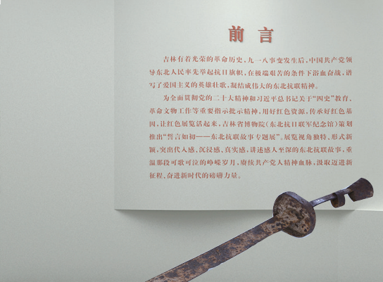
第四展区重点文物：铁血少年营使用过的单刀