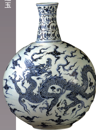
青花云纹扁瓶 南京博物院藏