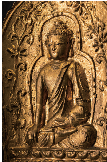
模印释迦牟尼描金佛砖 南京博物院藏