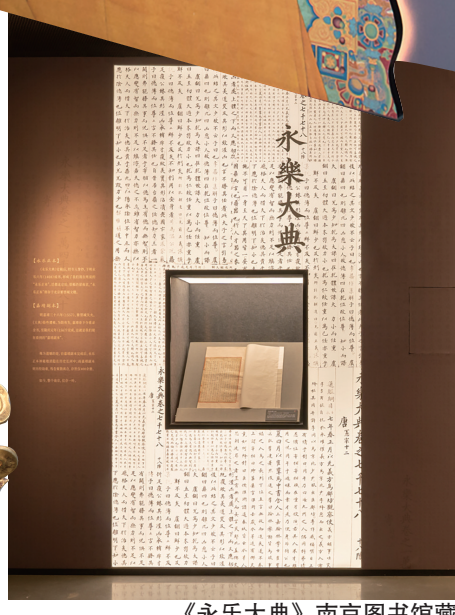
《永乐大典》南京图书馆藏