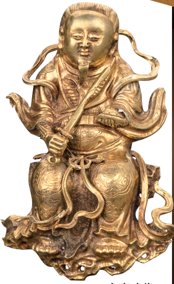
金真武像 首都博物馆藏