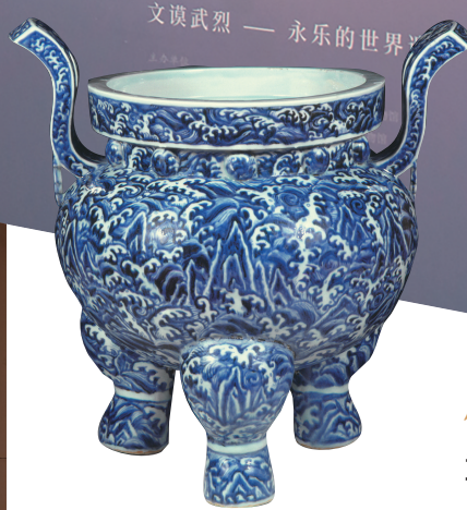
青花寿山福海纹三足炉 南京博物院藏