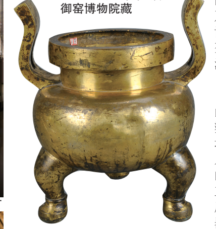
永乐款铜鎏金圆腹三足炉 青海省博物馆藏