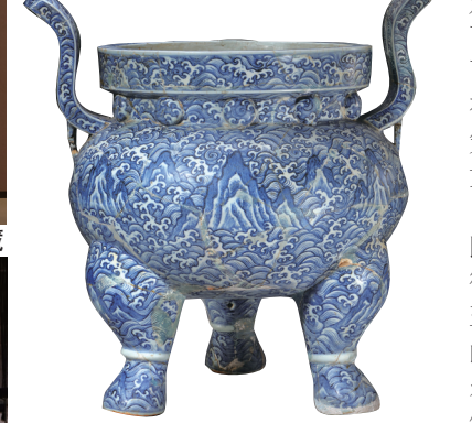
青花江崖海水纹双耳三足炉 景德镇御窑博物院藏