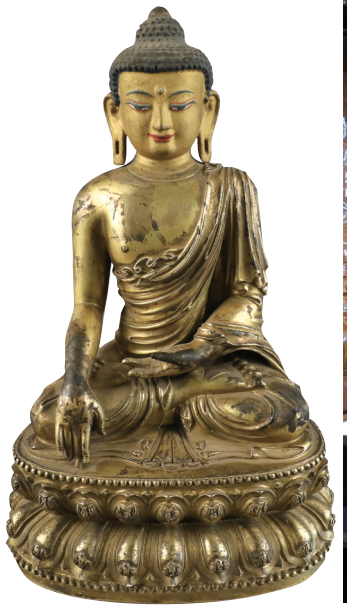
永乐款释迦牟尼坐像 布达拉宫管理处藏