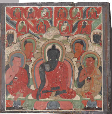
彩绘不动佛木板画 青海省博物馆藏