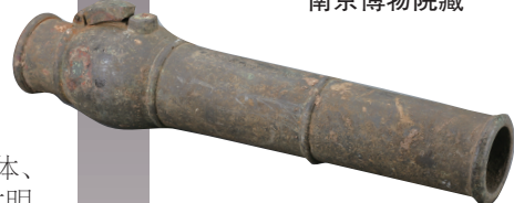
“英字壹万伍千叁拾肆号”铜手铳 首都博物馆藏