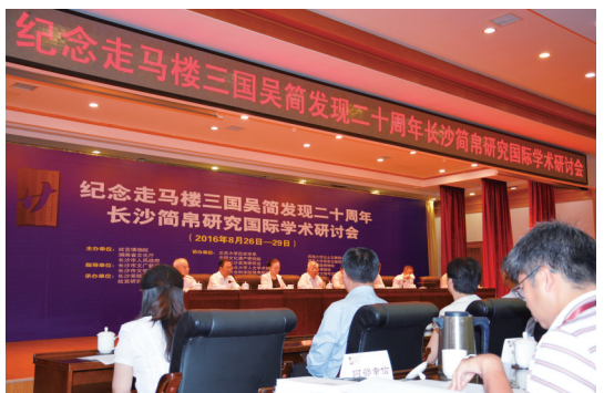
纪念走马楼三国吴简发现二十周年长沙简帛研究国际学术研讨会

以丰厚的科研成果为根基,长沙简牍博物馆不断提升文物利用水平,讲好讲“活”中国故事。近年携手湖南省广播电视局创作了“听见简牍”系列节目。该节目分为三季,聚焦中国简牍文化精华,从中甄选最值得讲述的亮点,讲述简牍蕴含的丰富故事,深受观众喜爱和各界认可。今年该系列节目获评第二届“全国文博社教十佳案例”,其中第二季《简牍里的中国精神》系列音频获评“湖南省优秀社会科学普及作品”。在此基础上,长沙简牍博物馆深挖简牍内涵,举办“大道至简——简牍里的中国精神主题展”,系统地展示简牍时代华夏民族的精神风貌。展览配套丰富的研学活动,馆长、专家、志愿者轮番授课,讲解简牍藏品背后的故事,让观众更加深入地了解古老简牍里蕴含的中国智