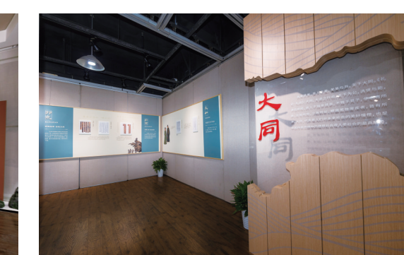
“大道至简——简牍里的中国精神主题展”展厅