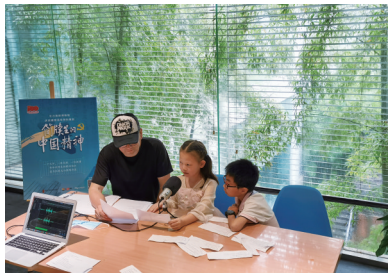
《简牍里的中国精神》情景剧录制现场