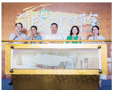
《简牍二十四节令》项目启动仪式