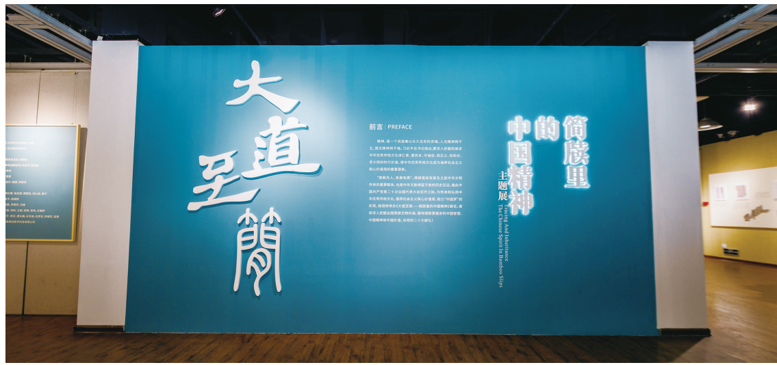
“大道至简——简牍里的中国精神主题展”展厅