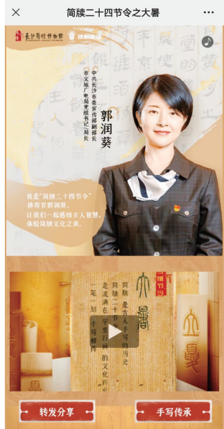
《简牍二十四节令》手写简牍H5