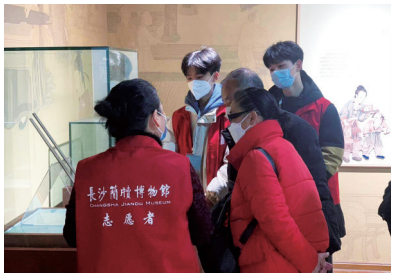
长沙简牍博物馆志愿者为观众讲解展览