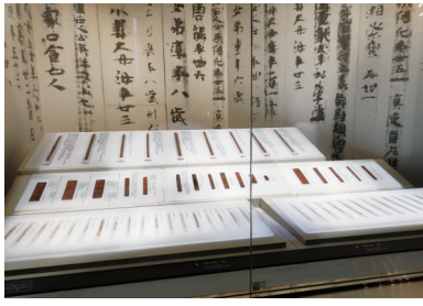
精品简牍展柜展出“嘉禾吏民田家别”等走马楼三国孙吴简牍

物馆是国内首座集简牍收藏、保护、研究和陈列展示等功能于一体的国家一级博物馆,拥有全国最丰富的简牍藏品,总数超10万件(约占全国三分之一),其中一级文物达1223件。历时近20年,长沙简牍博物馆完成10万余枚走马楼吴简的科技保护和释文工作,饱水简牍保护经验还在全国推广,起到了行业标杆和示范作用。同时,整理出版吴简图书共11卷(33册),近8万幅图版,达200万字。《长沙走马楼三国吴简·竹简》(9卷27册)获得第五届中国出版政府奖。