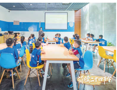
《简牍二十四节令》古诗韵律课