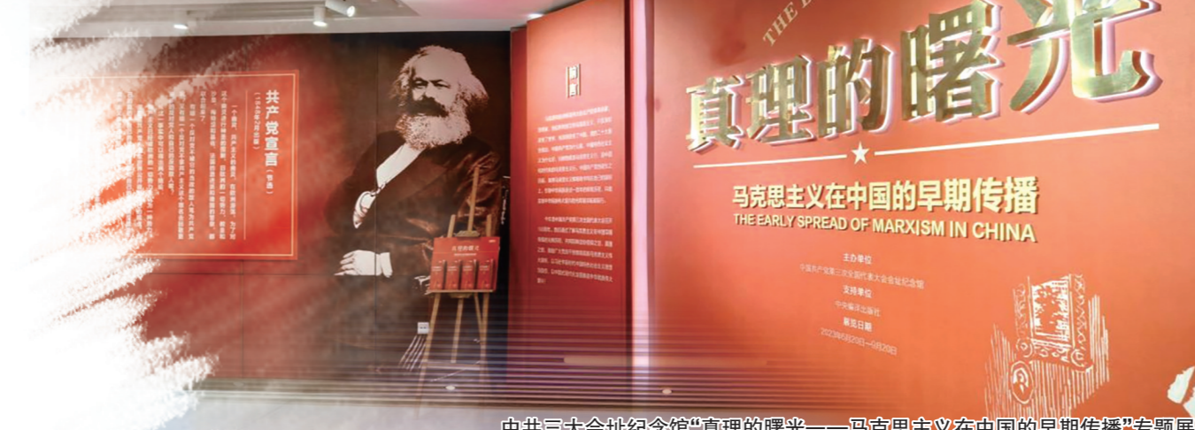
中共三大会址纪念馆“真理的曙光——马克思主义在中国的早期传播”专题展