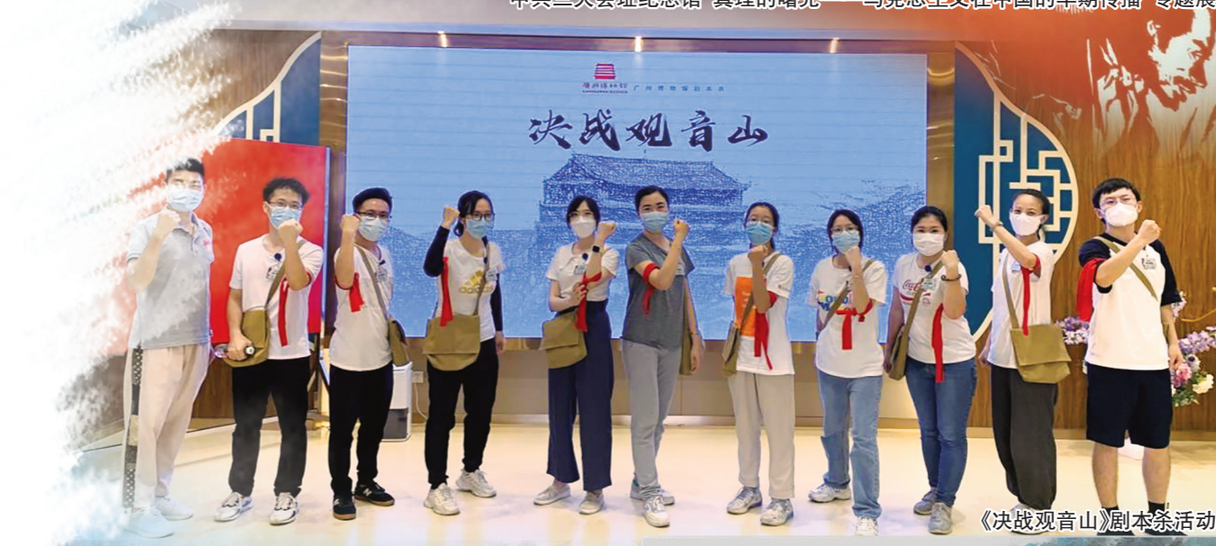
《决战观音山》剧本杀活动