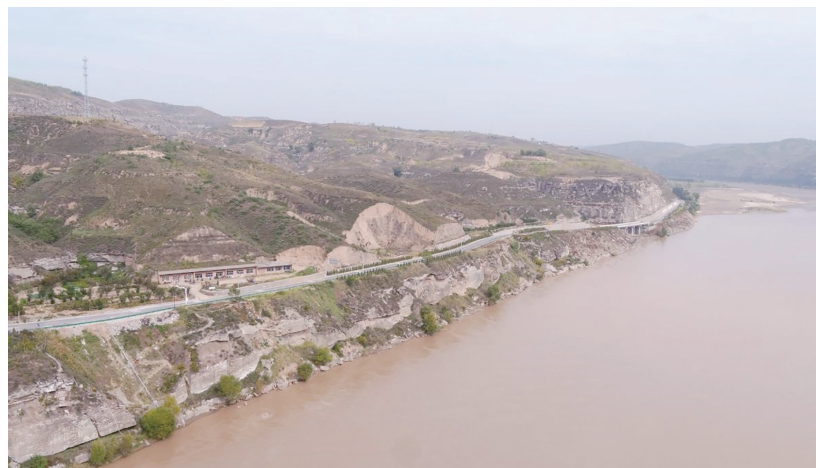
黄河沿岸旧石器遗址

2019年至2023年，在黄河西岸及其支流无定河、北洛河等流域，新发现150余处旧石器遗址，多样化的石器技术面貌，展现了距今70多万年至1万年前后古人类生生不息、绵延不绝的生存画卷；2021年至2022年，在南洛河流域首次发掘揭露出厚达24米的地层堆积物，发现了距今110多万年至3万年前左右长达百万年、基本连续的古人文化遗存；2022年至2023年，在石川河流域首次发现旧石器遗址，填补了渭北中部广大区域旧石器遗址分布的空白。特别是在其中的庙沟遗址，发现了一处包含丰富石制品，距今60多万年至3万年前的典型黄土剖面，将该地区古人类的活动上溯至距今约60万年前。在朱黄堡遗址，