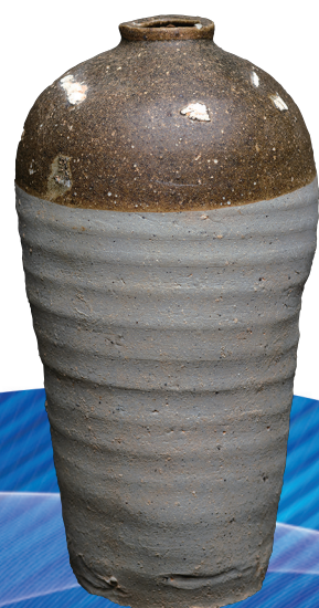
香港九龙圣山遗址出土磁灶窑酱釉小口瓶