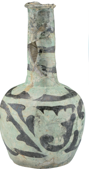
磁灶窑绿釉褐彩长颈瓶