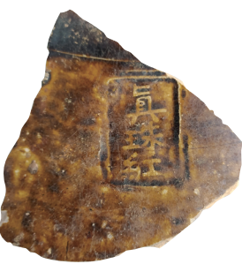
“真珠红”款酱釉罐残片