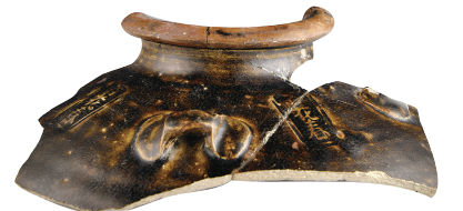
“百花春”款酱釉罐残片