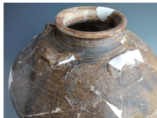
南越国官署遗址出土花卉纹带纹“德”字酱釉四耳罐