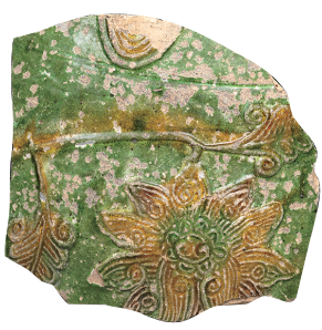
澳门圣保禄学院遗址出土黄绿釉陶罐残片