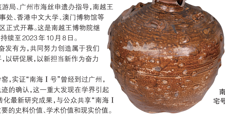
南海奇石窑“潘宅号”酱釉四耳罐

随着海上贸易的发展，形成了以广州港为中心，香港、澳门等地为中转的多层次贸易港口体系。港口城市、外港、航路节点、补给点、巡检点等遗址及其出土的相关文物遗存，是这一体系的重要实物见证。本次展览通过实物和史料，将粤港澳三地的历史文化遗产进行有效串联，立体展示了