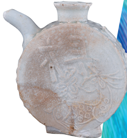
德化窑青白釉扁执壶