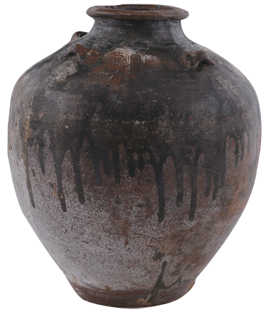
“南海I号”出水“丙子年”印文酱釉四耳罐