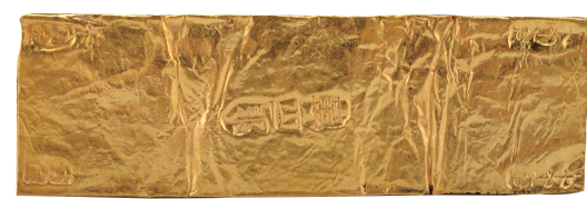
“十分金韩四郎”铭款金叶子