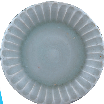
龙泉窑青釉菊瓣纹碟