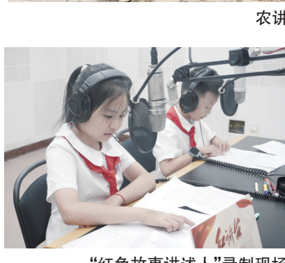
“红色故事讲述人”录制现场