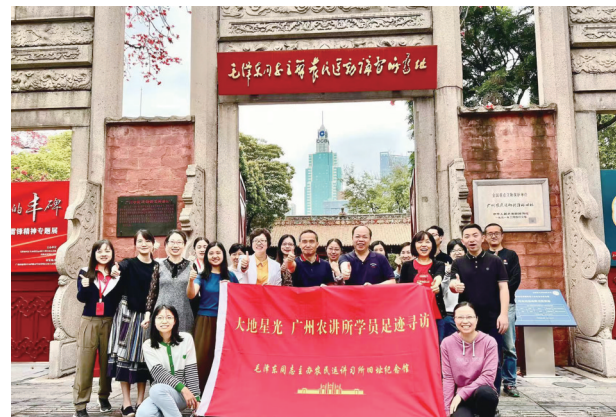
农讲所学员足迹寻访项目