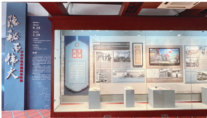
“隐秘而伟大——中央红色交通线历史展”

以守正创新的正气和锐气,赓续历史文脉,踔厉奋发、勇毅前行,以更加昂扬的姿态奋进新征程,建功新时代,在新的赶考之路上向历史和人民交出新的优异答卷。