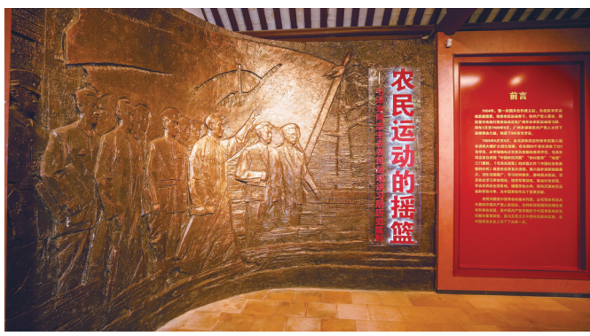
“农民运动的摇篮——毛泽东同志主办农民运动讲习所历史陈列”