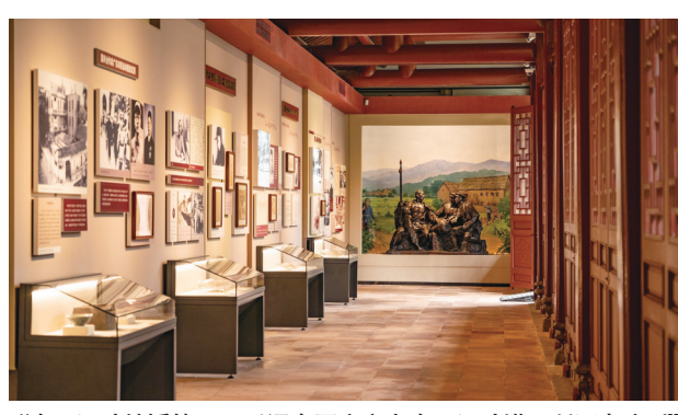
“农民运动的摇篮——毛泽东同志主办农民运动讲习所历史陈列”