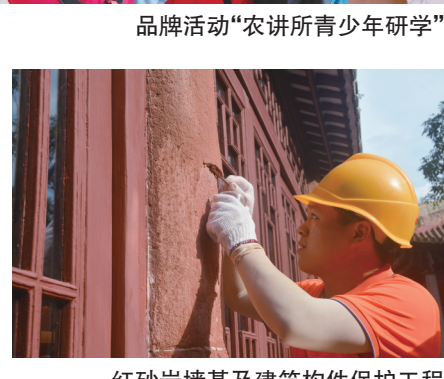
红砂岩墙基及建筑构件保护工程