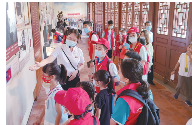
品牌活动“农讲所青少年研学”