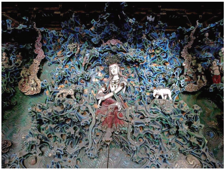
图1 正定隆兴寺摩尼殿五彩悬山