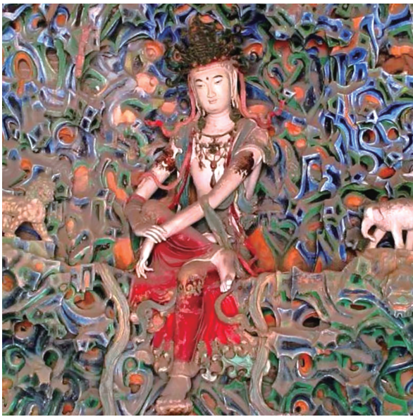
图2 正定隆兴寺水月观音

被誉为“中国十大名寺之一”“京外第一刹”的正定隆兴寺，始建于隋开皇六年(586)，原名“龙藏寺”，清康熙四十八年(1709)改名“隆兴寺”。《隆兴寺志》记载：大觉六师殿“五彩悬山四座，玲珑庄严”，摩尼殿“背后五彩悬山一座，玲珑庄严”，大悲阁“殿内东墙悬山一座，玲珑庄严”“殿内西墙悬山一座，玲珑庄严”，“东千佛洞五彩佛一千尊，各高一尺”，“西千佛洞五彩佛一千尊，各高一尺”。这些绚丽的悬塑装饰集中体现了宋初壁塑艺术的最高水平。但是大觉六师殿的四座五彩悬山于民国初年随着大殿的坍塌而踪影皆无，大悲阁的壁塑也在1944年楼因重修时毁坏殆尽，现在能看到的唯有摩尼殿北侧内槽的五彩悬山(图1)。