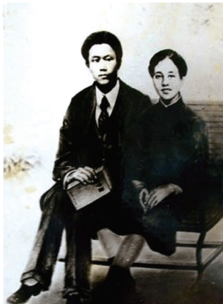
蔡和森、向警予结婚照