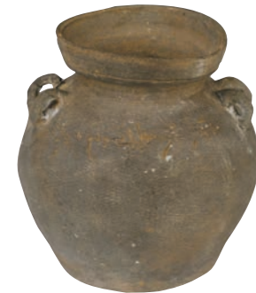
晋“东林寺乞米”款陶罐

在当代博物馆的经营理念中，社会教育不单是其对社会的责任，同时也是博物馆的首要功能。项目组针对故宫博物院讲解员开展专项培训，旨在使讲解员了解零废弃理念与零废弃倡导方式，并具备在实际工作中独立向观众开展零废弃倡导的能力。培训分为线下授课和实地讲解两个部分，并设置考核环节。培训人员不仅详细讲述零废弃科普知识，还结合明清时期紫禁城的节约故事，挖掘故宫文物中的零废弃理念，按照故宫经典讲解路线，从建筑、人文等角度进行讲解授课，鼓励讲解员将节俭环保的故事穿插于讲解服务中，培养观众零废弃意识。