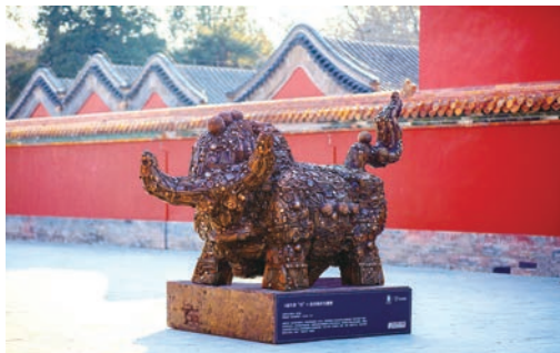
《福牛辞“旧”》再生雕塑

自2020年5月1日新修订的《北京市生活垃圾管理条例》施行以来，各党政机关和事业单位发挥示范引导作用，逐步实现全社会覆盖，广大人民群众群众生活环境逐步改善，群众满意度不断提升，绿色低碳生活成为新时尚。