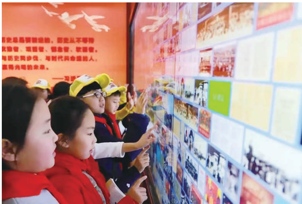
学生们通过胶东革命历史触摸屏学习党史

2020年1月，故宫博物院与万科公益基金会共同发起“故宫零废弃”垃圾分类项目（简称“故宫零废弃”项目）并成立故宫零废弃执行委员会，希望通过一系列活动，将其打造成为国际领先的“零废弃博物馆”，进而引领更多人践行低碳环保的新生活方式。3年来，该项目已取得很大进展。