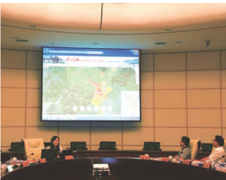
建设红色旅游数字系统