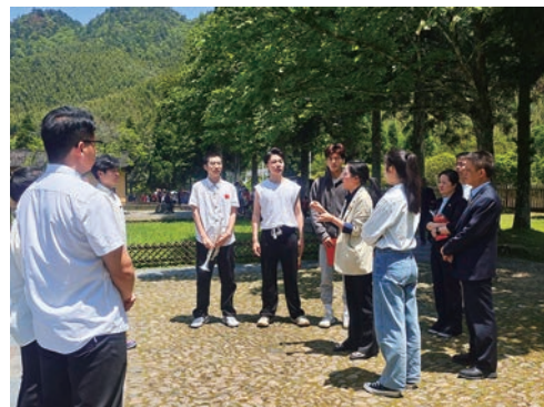
馆长指导大学生在旧址进行现场教学