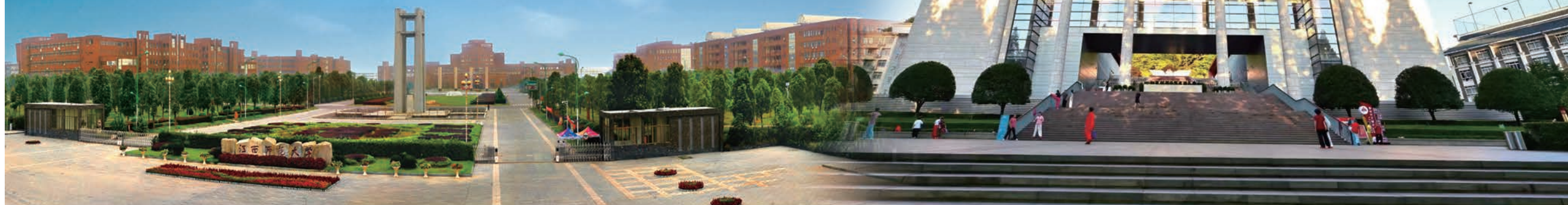
江西师范大学(左)井冈山革命博物馆(右)

2022年6月27日,井冈山革命博物馆与江西师范大学本着优势互补、互惠共赢、相互支持、共同发展的原则,结合新时代红色文化传承新要求,着眼于全面推动校馆双方的合作深化,建立、巩固和发展双方长期、稳定的合作关系,共同签订了合作创建革命文物协同研究中心框架协议。双方将利用馆校各自优势,打造和建设国家级水准、创新性、示范性和引领性的革命文物协同研究中心、红色资源研究高地、革命文物保护利用高端智库、革命文化学术交流重要平台和红色资源共建共享中心。协同开展革命文物赋能大思政的实践应用研究,深入挖掘革命文物思政育人元素,开发革命文物大思政精品教材、建设特色鲜明的革命文物大思政课程体系、打造革命文物实践点,开展好红色基因传承重大理论研究、革命文物与革命文化传播创新研究、革命文物展陈与数字化等多方面研究。