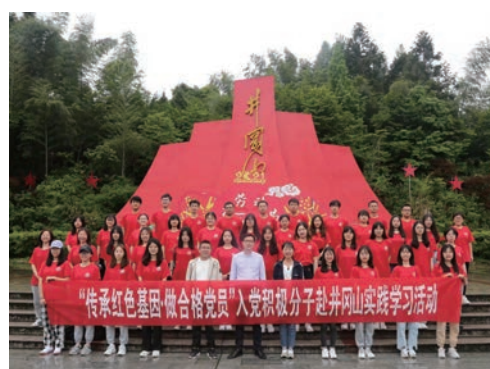
校师生在井冈山开展实践活动