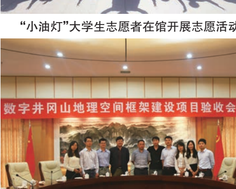
馆校搭建科研平台