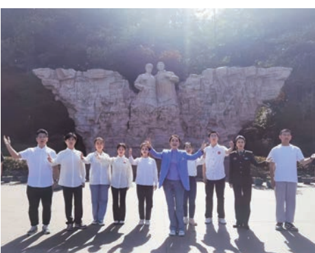
“小油灯”大学生志愿者在馆开展志愿活动