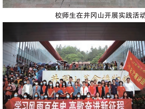
校师生来馆进行红色文化宣传