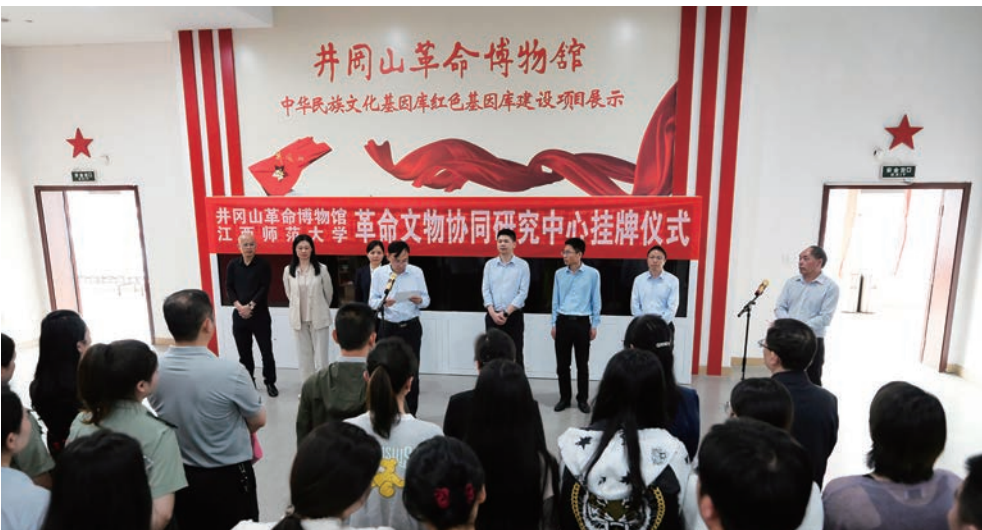
井冈山革命博物馆革命文物协同研究中心挂牌仪式