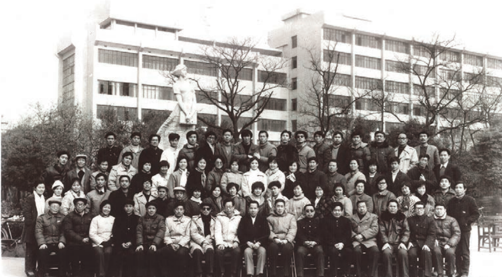
馆校合作历史悠久

学校始终以服务江西经济社会发展和教育事业为使命,充分发挥在江西科学发展中的“人才库”“发动机”和“智力源”作用。在17家重点新型智库建设试点单位中,区域发展研究院、苏区振兴研究院获批江西省首批重点高端智库。其中,苏区振兴研究院入选CTTI中国高校百强智库,是全国唯一一家专门从事革命老区振兴发展研究的百强智库。学校参与推动出台两个原中央苏区振兴发展规划,近五年获得省级及以上领导肯定性批示135次,其中,党和国家领导人批示5次,有的已被转化为政府文件或项目。