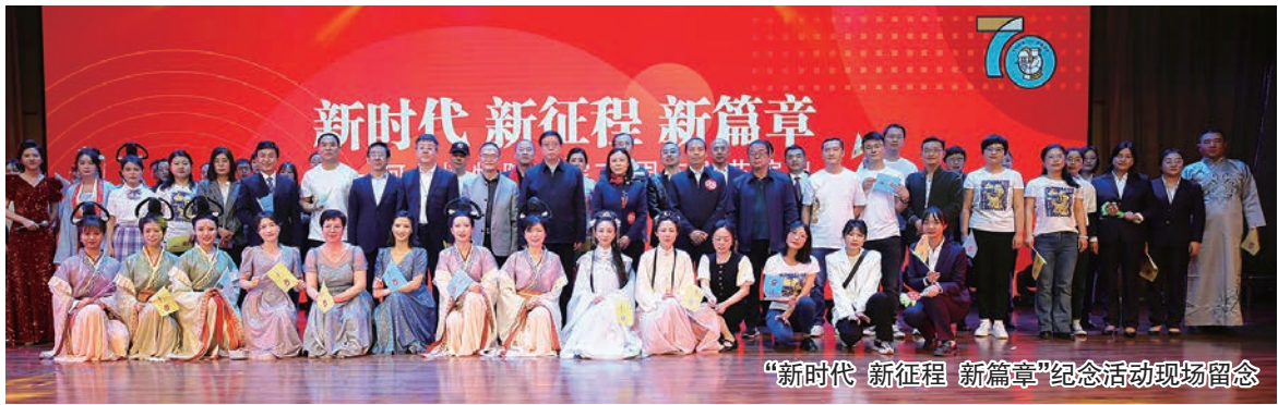
“新时代 新征程 新篇章”纪念活动现场留念

在刚公布的全国第六次博物馆运行评估(2019—2021年度)中,河北博物院评估结果为“优秀”,这是对河北博物院事业高质量发展的充分肯定。新征程新起点,河北博物院将继续全面贯彻落实党的二十大精神,新时代文物工作方针,扎实开展习近平新时代中国特色社会主义思想主题教育,不忘初心、牢记使命,秉持求真务实、守正创新的精神,踔厉奋发、勇毅前行,为发展社会主义先进文化、弘扬革命文化、传承中华优秀传统文化不懈努力,为满足人民群众对美好生活的需求不懈奋斗,为中国式现代化河北场景作出新的贡献。