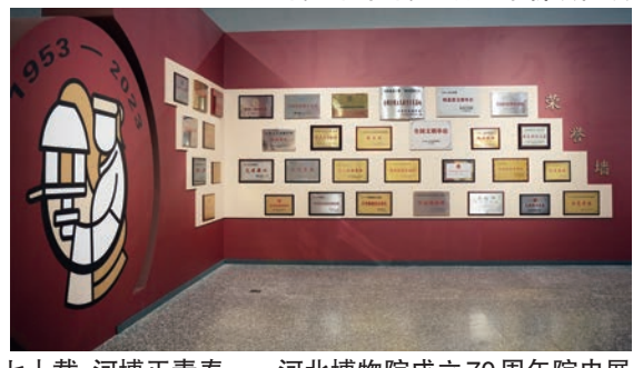
七十载·河博正青春——河北博物院成立70周年院史展