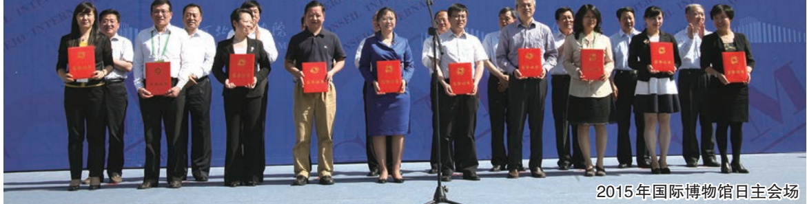
2015年国际博物馆日主会场