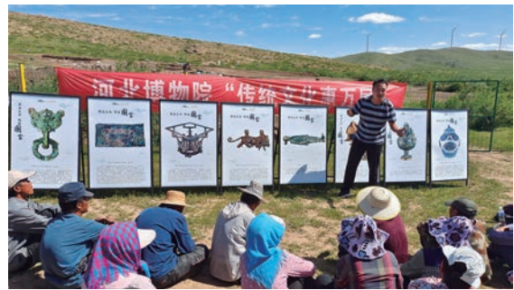
“传统文化惠万家”品牌教育活动

2023年是河北博物院成立70周年,河博人积极策划办专题展览、组织社教活动、研发文创产品、刊载专栏文章、举办老专家座谈会等,以谢过往、以绘观众、以勉未来。七十年,河北博物院的诞生前行与时代脉搏紧密相连,点滴成长,荣誉进步离不开一代代河博人的奉献坚守,离不开各级领导的指导支持,离不开广大观众的