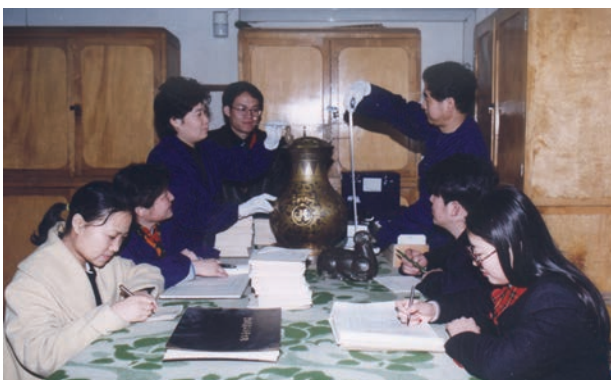
河北省博物馆工作人员进行文物登记

博人中的优秀代表,他们的远见卓识和苦心孤诣,随着时间推移和文物价值的凸显,愈发熠熠生辉。