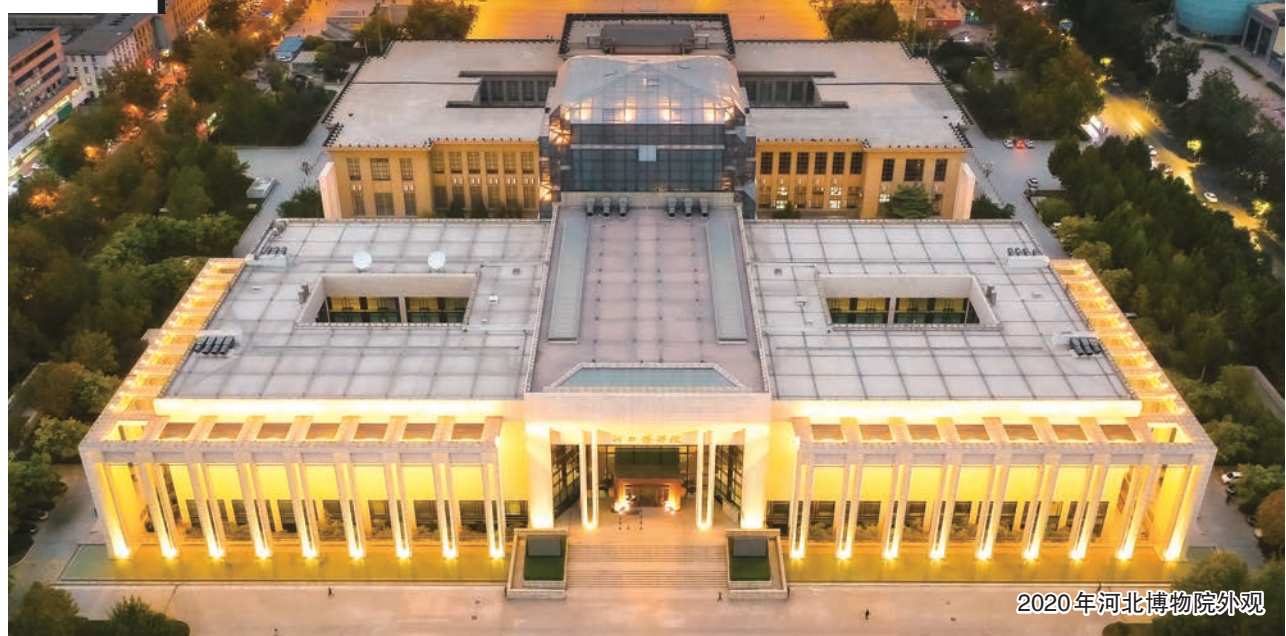
2020年河北博物院外景