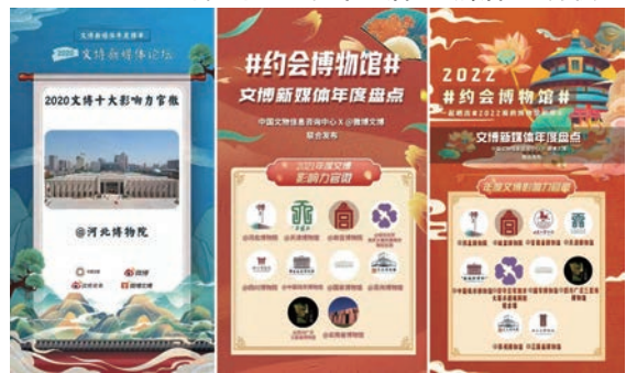
河北博物院微博连续三年斩获佳绩