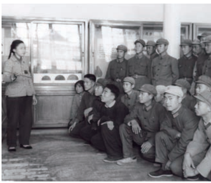
1966年5月,“河北历史文物专题展览”开展

映河北的重大事实和人物。1995年起,先后推出“血肉筑长城——河北人民抗日纪实”“神秘的王国——战国中山国”“金缕玉衣的故乡——满城汉墓”“古代河北”“近代河北”“当代河北”等6个基本陈列。与此同时,“迎接香港回归祖国大型图片展”“石家庄市三年大变样规划展”等一批关注爱国主义教育和红色文化宣传、服务精神文明建设的、歌颂改革开放新成就的临时展览也在不断推出,基本陈列辅以临时展览的展陈体系基本成型。外推展览实现突破性进展,1996年“满城汉墓展”在韩国传统工艺美术馆展出,将燕赵文化推向世界。