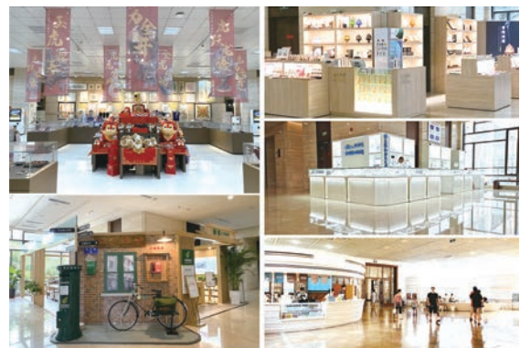
河北博物院文创“中心店+品牌店”服务模式