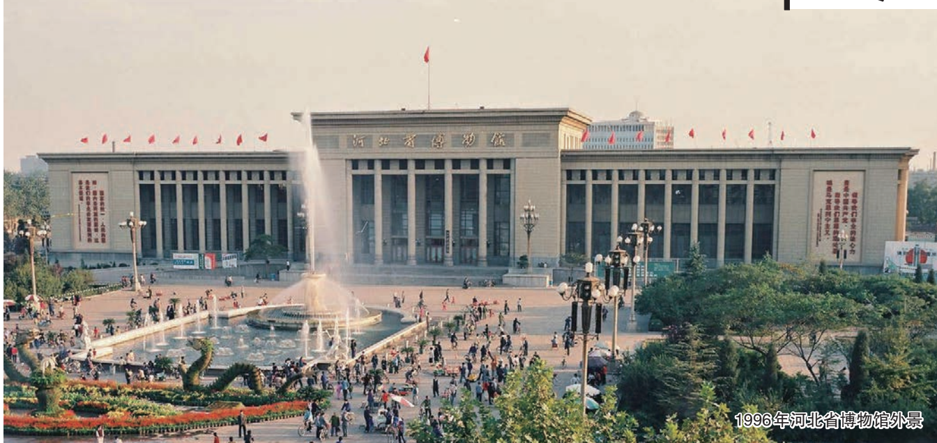
1996年河北省博物馆外景