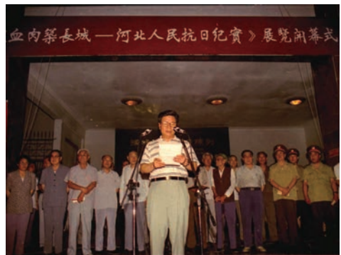
1995年7月7日,为纪念抗日战争胜利50周年“血肉筑长城——河北人民抗日纪实”展览开幕

1994年前后河北省博物馆在“面向社会、面向时代、面向社会主义现代化建设”的办馆方针指导下决心对基本陈列体系改陈,以重点反映河北的昨天和今天、重点反