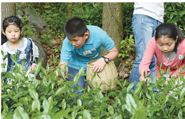
中国茶叶博物馆“牛牛习茶社”采茶活动