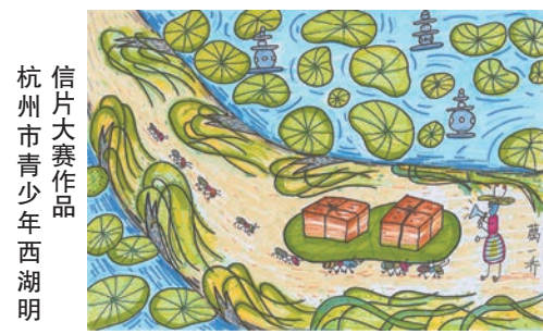
明信片大赛作品 杭州市青少年西湖明信片大赛作品