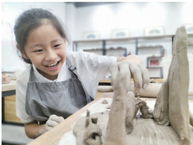
杭州市萧山区博物馆的“小小陶艺家”

人员专业。 博物馆讲解员是青少年教育活动开展的主力军,其服务质量和态度直接影响博物馆教育活动的质量和对外形象的树立。2008年,杭州市在多年探索实践的基础上,制订了《博物馆(纪念馆)及景区讲解员管理办法》《讲解员职业标准》《讲解员等级评定实施细则》及有关奖励政策等,推出了星级讲解员评比考核制度,按照讲解水平从低到高将讲解员分为5个星级。实行一年一考一评,每年根据星级给予相应的岗位津贴,确保长效竞争机制的建立。15年来,由杭州市园林文物局牵头的杭州市星级讲解员评比活动,以评促学,以学促行,先后有多名讲解员多次获得全国及浙江省讲解员大赛最高荣誉,进一步提高了讲解员队伍的专业素质。