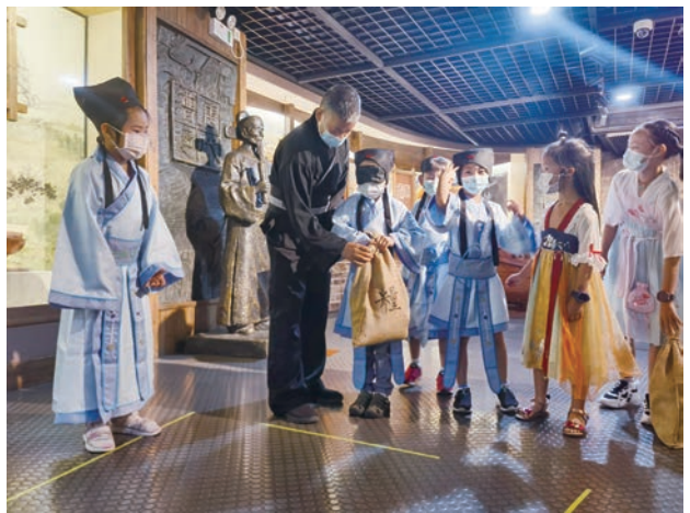
杭州京杭大运河博物馆的小书童体验搬运粮食