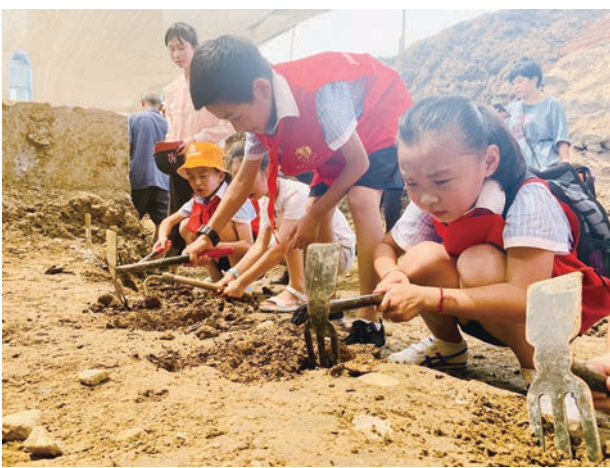
杭州市临安区博物馆的青少年体验考古