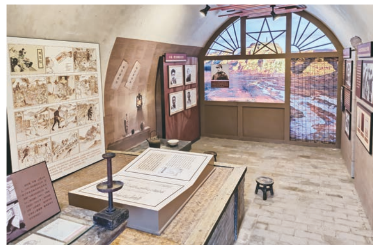
“为抗战吹响号角——中国共产党与抗战文化”巡展走进山西武乡北漳延安鲁艺旧址

革命类纪念馆见证了中国革命带领中华民族争取民族独立、人民解放和实现国家富强、人民富裕的具体实践,收藏着中国人民的独特记忆。随着党史学习教育持续推向深入,人民群众到纪念馆参观革命主题展览成为开展“大思政课”教育的主要形式。受展览展期等因素限制,走出纪念馆展厅、下沉基层进行思政教育的流动展览,成为革命类纪念馆推进红色文化传承的重要抓手。