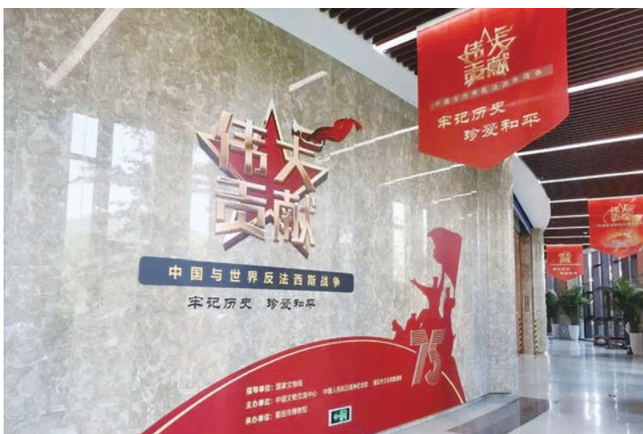
“伟大贡献——中国与世界反法西斯战争”巡展走进莆田市博物馆