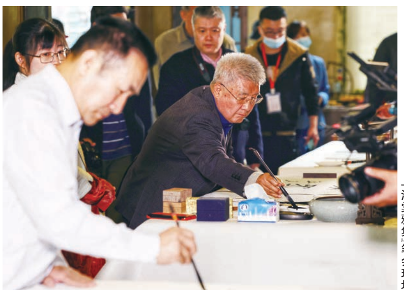
海蒙雅集笔会现场

安阳市相关领导表示,要不断擦亮安阳“中华字都”名片,活化传承中华优秀传统文化,不断创新方式,让甲骨文活起来,让文字动起来,让传统文化之美直抵人心。