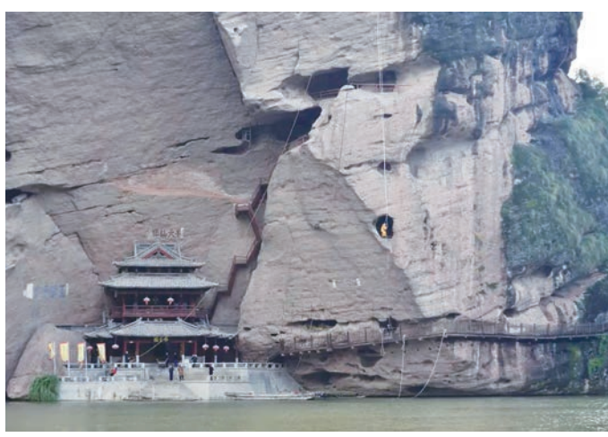
仿古模拟吊棺试验