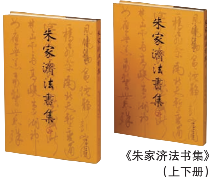
《朱家济法书集》(上下册)

朱家济(1902—1969)，字豫清(豫卿)，又字余清。20世纪中国文化界的代表人物之一，是中国杰出的书法家和书法教育家，作为中国高等书法教育事业的开创者之一，曾受聘担任浙江美术学院(今中国美术学院)首届书法专业主课教师。朱先生擅真、行、草三体书法，对书法传统有极深的理解，作品俊丽清健、笔跃气振，代表了时代的高度。《朱家济法书集》搜集了公私收藏的先生遗墨，包括信札、文稿、诗文题跋等多类法书作品，按类型分编为上下册，全面展示了先生书法实践的高度和广度。