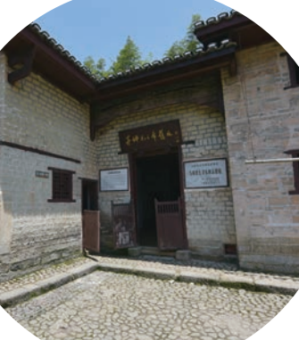
八角楼毛泽东旧居