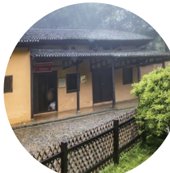
茨坪新遂边陲特区公署