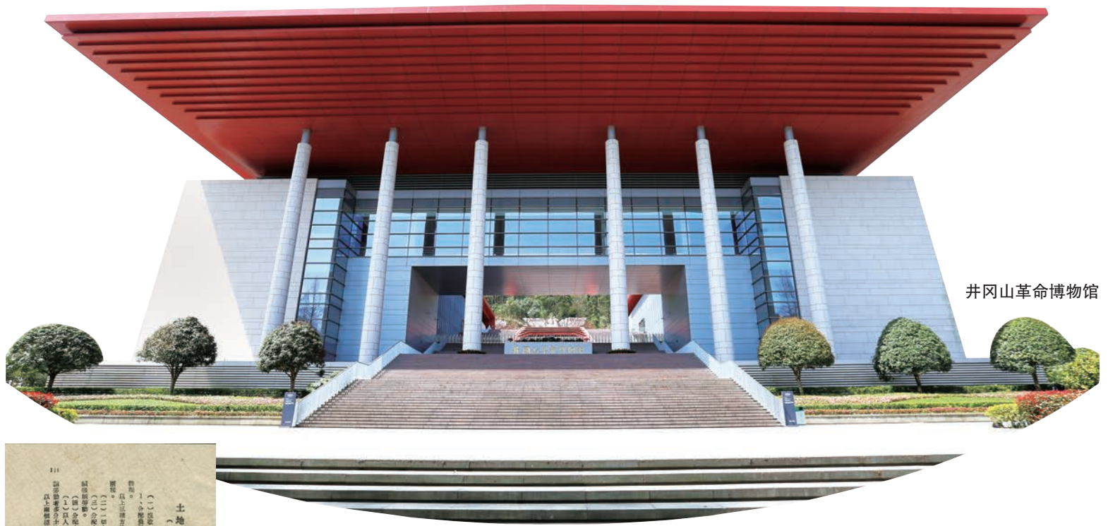
井冈山革命博物馆