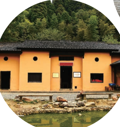
茨坪毛泽东同志旧居