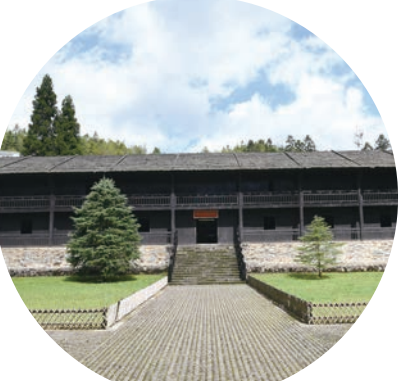
小井红四军医院旧址