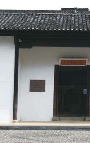
大江毛泽东同志旧居