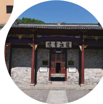
毛泽东、朱德同志会见旧址