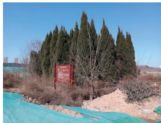
完成整改后的临淄墓群正在实施文物长制网格化管理

此次案件属于未经批准擅自在全国重点文物保护单位保护范围内进行建设工程，在文物领域是典型的违法行为。但是因为同一当事人在同一个建设项目上，因为同一违法事由、不同的违法行为被行政处罚三起，属于系列案件。此外，当事人在整个项目动工之前已经办理了该宗地的考古、勘探手续，可以说并不存在主观上故意违法的情况。之所以出现违法行为，主要是因为项目规划不合理。虽然在规划的时候考虑了文物保护单位，规划方案没有侵占文物保护单位范围，但是