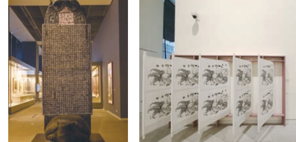
“藉器传文”展厅复制 “神州迎春”展厅木版年画体验区的《颜氏家庙碑》