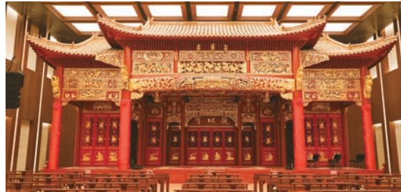
“盛世重光”多功能厅戏台