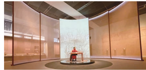
“旷古遗音”展厅互动演奏区