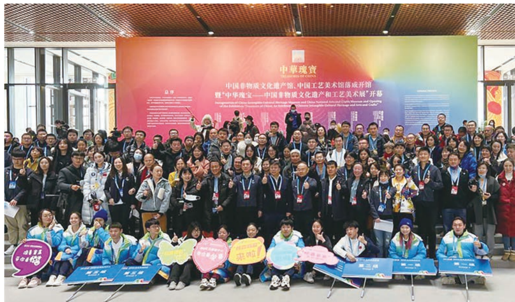
160余名中外记者参观“中华瑰宝展”

“中华瑰宝展”各板块独立成章,力求以点带面,展示中国传统工艺美术和中国非物质文化遗产在坚守中华文化立场、传承中华文化基因、展现中华审美风范方面取得的巨大成就。