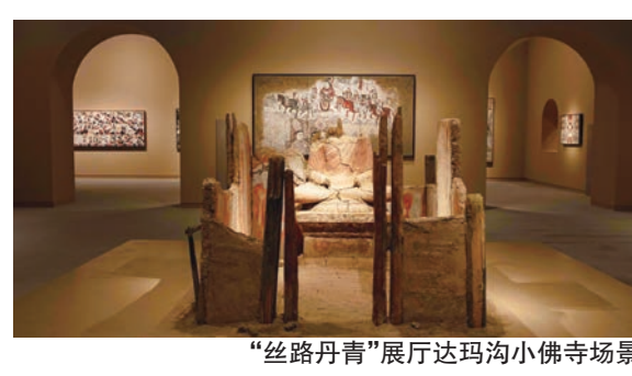
“丝路丹青”展厅达玛沟小佛寺场景