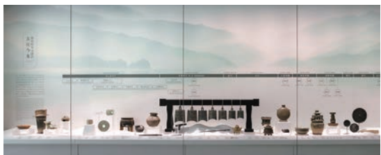
第一单元“何处是江南——地域的江南”文物展示

博物馆分为东、西两个馆区,分列于相邻两栋独立建筑。其中东馆区建筑采用粉墙黛瓦的江南民居为设计元素,质朴淡雅,主要陈列“春风又绿——江南水乡文化展”,展陈面积约2600平方米。