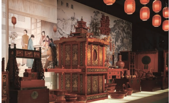
第三单元“诗意栖居处——生活的江南”