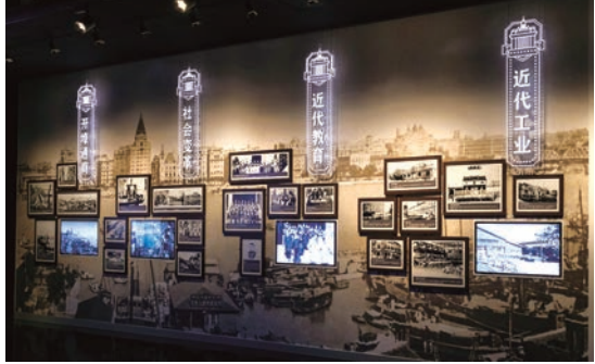
第五单元“春风无尽绿——转型的江南”