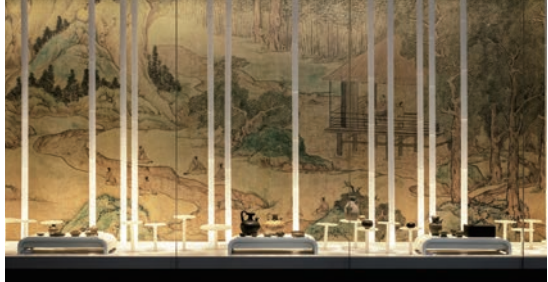
第四单元“文采尽风流——文化的江南”