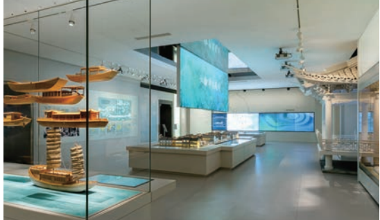
第二单元“富庶鱼米乡——经济的江南”