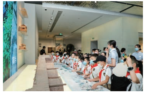
“小伢儿嗨游博物馆”

十里红妆 旧时,江南地区盛行重聘厚嫁之风,尤以宁绍地区嫁女时“十里红妆”的场面最具代表。富室人家为出嫁的女儿置办日常起居所需的一切家具器皿作为嫁妆,婚礼前一天,嫁妆队伍从女家一直延伸到夫家,一眼望去十里皆红,洋溢着吉祥喜庆,炫耀着家产的富足。