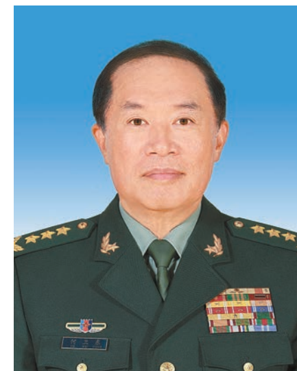
中华人民共和国中央军事委员会副主席 何卫东

张又侠，男，汉族，1950年7月生，陕西渭南人，1968年12月入伍，1969年5月加入中国共产党，军事学院基本系毕业，大专学历。