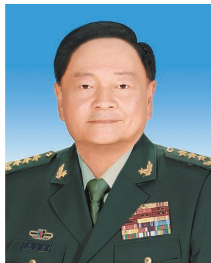
中华人民共和国中央军事委员会副主席 张又侠