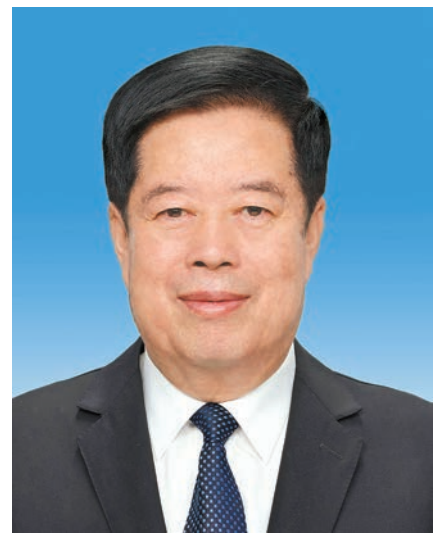
国家监察委员会主任 刘金国