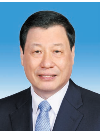
最高人民检察院检察长 应勇

刘金国，男，汉族，1955年4月生，河北昌黎人，1976年12月参加工作，1975年9月加入中国共产党，中央党校大学学历。