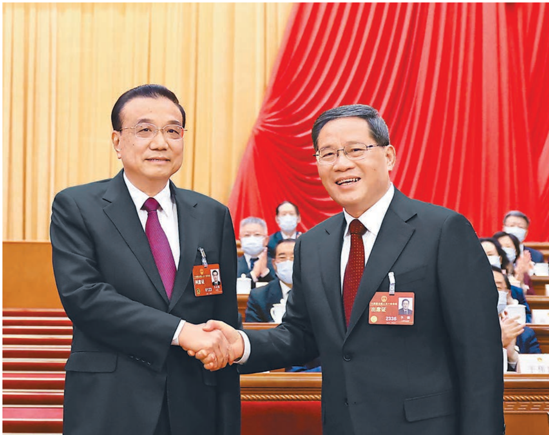
三月十一日，十四届全国人大一次会议在北京人民大会堂举行第四次全体会议，根据国家主席习近平的提名，经过投票表决，决定李强为中华人民共和国国务院总理。这是李强同李克强握手。