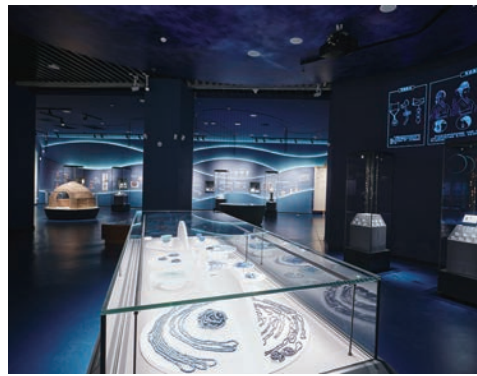
“合浦启航”第一部分与第二部分相交处