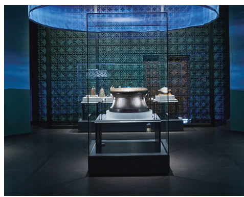
广西古代文明陈列 铜鼓

“广西古代文明陈列”和“合浦启航——广西汉代海上丝绸之路”是两个最能体现广西历史文化特色的基本陈列。前者以历史的视角,展示广西古代文明的演变进程,彰显广西在中华民族大一统格局形成中的重要作用;后者是前者的深化与拓展,讲述广西在古代海上丝绸之路中的独特地位,两者共同阐释广西古代文明“悠久、多元、交融、开放、同心”的特点。