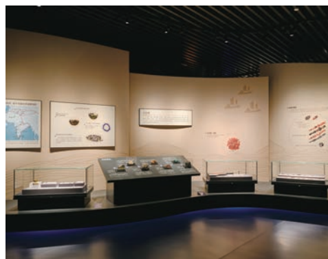
“合浦启航”第一部分第二单元