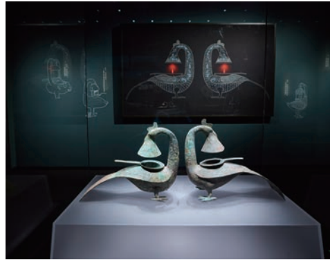
广西古代文明陈列 凤灯