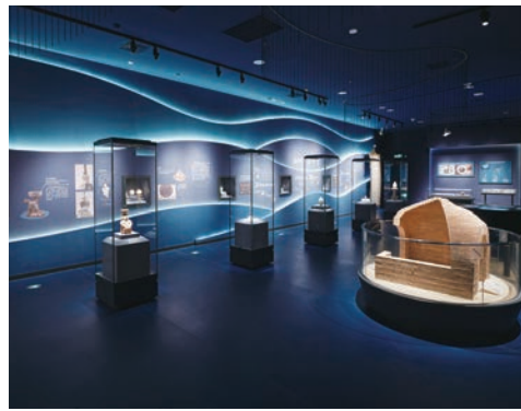
“合浦启航”第二部分