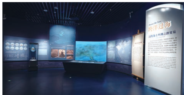
“合浦启航”第一部分第一单元