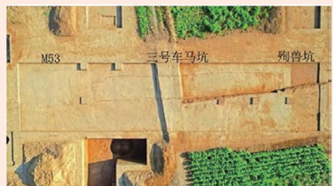
故郡M53、三号车马坑、殉牲坑关系(墓葬在西侧)