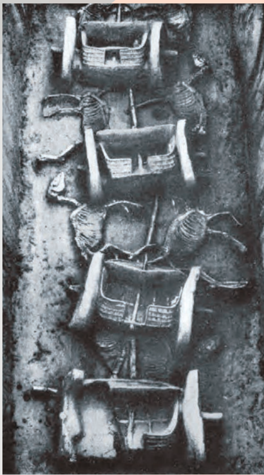
上村岭虢国墓地第1727号车马坑