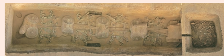
故郡车马坑CMK2及殉牲坑M25(上为西北)