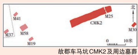
故郡车马坑CMK2及周边墓葬