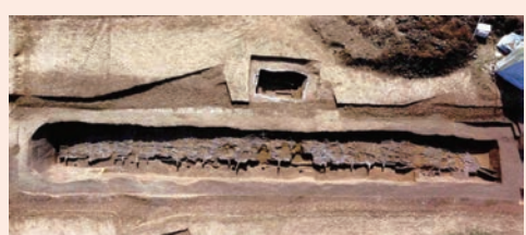
枣阳郭家庙曾国墓地1号车坑