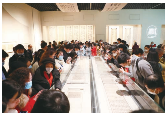
展厅观众络绎不绝