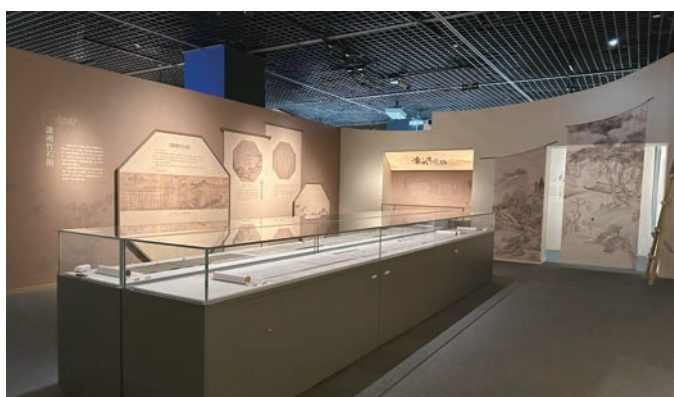
“苏轼主题文物特展”展厅