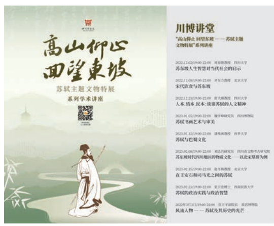
特展系列学术讲座海报