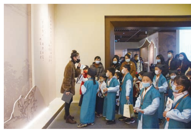
《人见人爱苏东坡》系列青少年主题研学活动现场