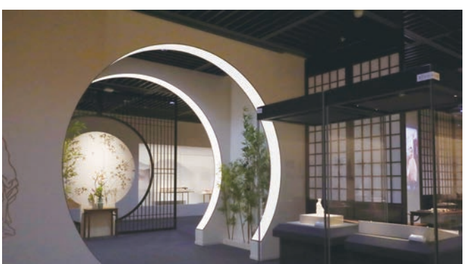
“苏轼主题文物特展”展厅