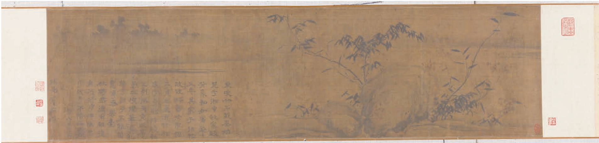
苏轼《潇湘竹石图》 中国美术馆藏

展览分为“苏轼主题文物特展”和“当代书画名家作品展”两个篇章。“苏轼主题文物特展”汇集了故宫博物院、中国美术馆、上海博物馆、吉林省博物院、旅顺博物馆、中国江南水乡博物馆、苏州博物馆、三苏祠博物馆、四川博物院等39家文博单位珍藏的苏轼主题相关文物274件(套)，其中一级文物39件，是四川博物院举办的展线最长、展厅面积最大、沉浸式体验场景最为丰富的大型专题展览，并且首次将《潇湘竹石图》《洞庭春色赋·中山松醪赋》卷、《阳美帖》三件苏轼罕见真迹及宋徽宗、董其昌、仇英、郑燮、张大千等名家真迹齐聚一堂。“当代书画名家作品展”由四川省诗书画院邀请全国各省市的代表性书画家围绕“东坡文化的当代诠释与演绎”展开主题创作。两个篇章古今联袂展出，带领人们穿越历史烟云，从文人士大夫风雅的北宋，沿着千年文脉走向文艺繁荣的今天，感悟新时代背景下的东坡精神。