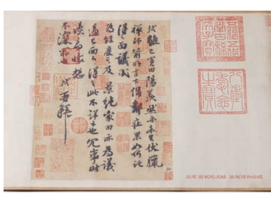
苏轼《阳美帖》 旅顺博物馆藏