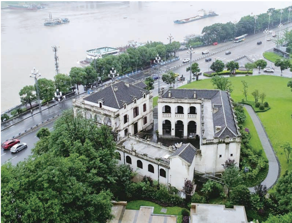
法国水师兵营旧址

近年来,重庆市南岸区认真贯彻落实新时代文物工作方针,创新探索,将文物保护利用工作与城市化建设相结合,融入生态文明建设发展理念,切实做到经济建设、文化发展和生态保护三位一体,取得实实在在的成效。