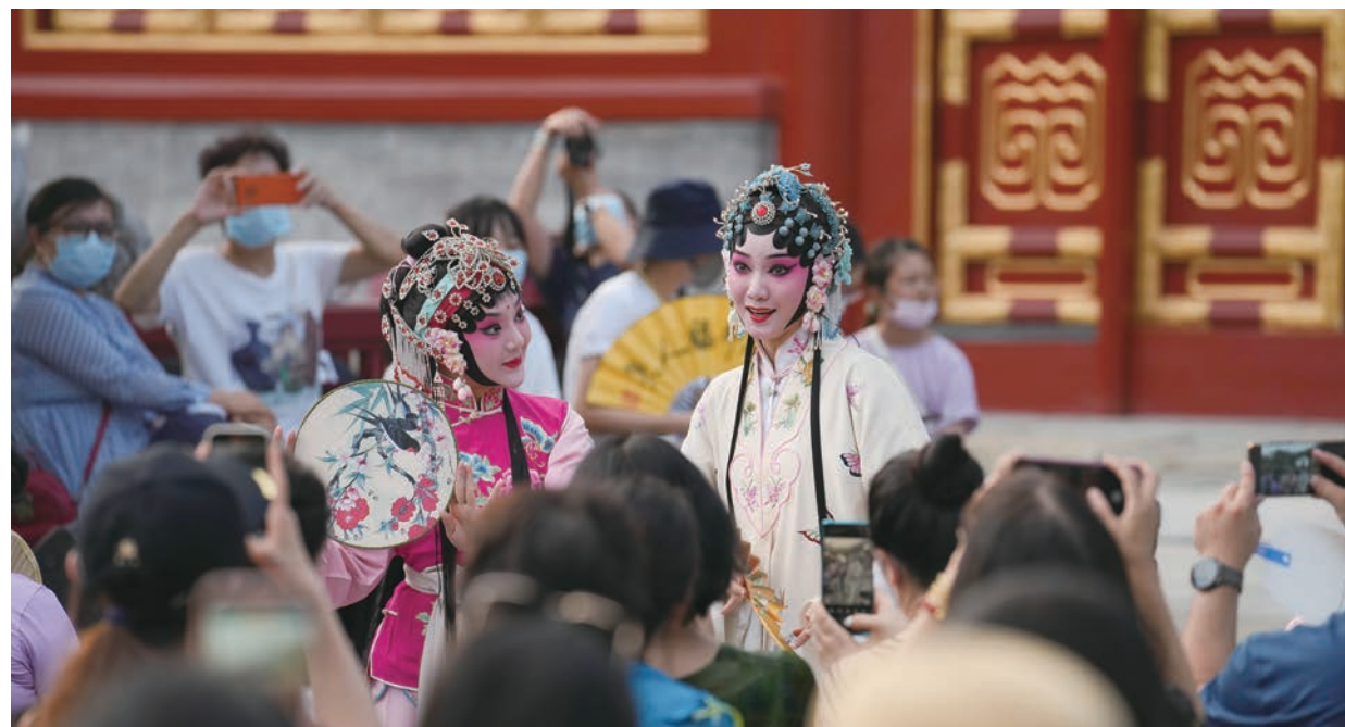
“在白塔寺遇见梅兰芳——京剧艺术分享夜”活动现场

近年来,文博行业蓬勃发展,博物馆数量增多、质量提高、功能日趋完善,游客量稳步提升,日益展现在社会发展中的重要作用。然而,一些中小博物馆、非国有博物馆在藏品、展览、教育、人才等方面还存在资源性短板,限制了其功能发挥和自身发展。北京市白塔寺管理处就是这样一座历史文化内涵深厚,但各类资源短缺的中小型历史遗迹类文博单位。