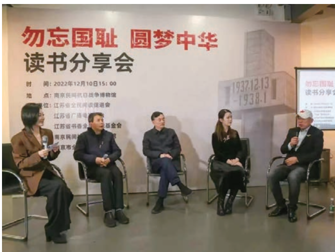
“勿忘国耻 圆梦中华”读书分享会

党的二十大报告指出:“空谈误国,实干兴邦。”没有实干,理想就会变成虚想;没有实干,为人民服务就变得虚无缥缈;没有实干,我们就无法战胜困难走向胜利。2022年,南京民间抗日战争博物馆紧紧围绕“守护文物是天职”“宣传历史是本职”“服务社会是履职”等三个方面开展系列工作,砥砺前行。