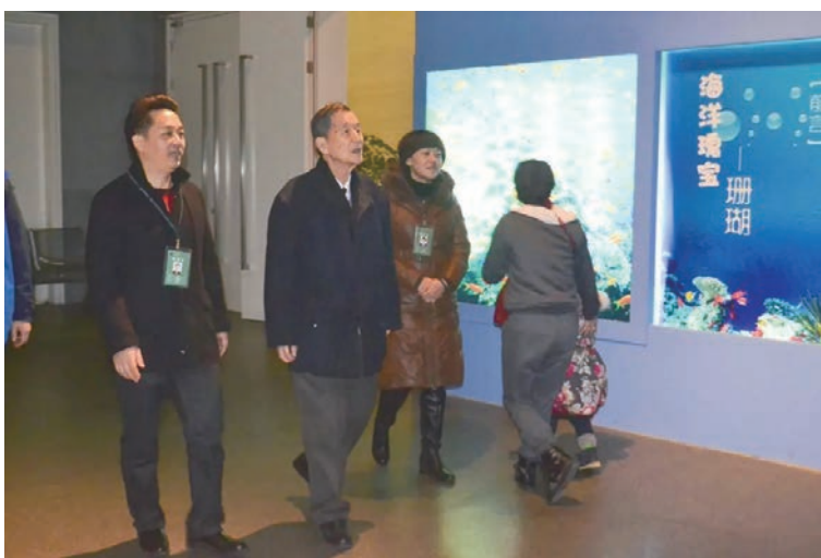
毛昭晰参观浙江自然博物院

我与妻子说,毛老师作为省级干部,今天还与我攀老乡。妻子说,这是毛老师的谦逊和对你的厚爱,要好自珍重。