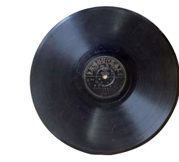
1935年百代公司第一版《义勇军进行曲》唱片