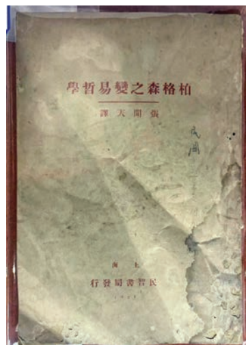
1924年张闻天译著《柏格森之变易哲学》