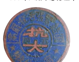
抗大一分校五期毕业证章