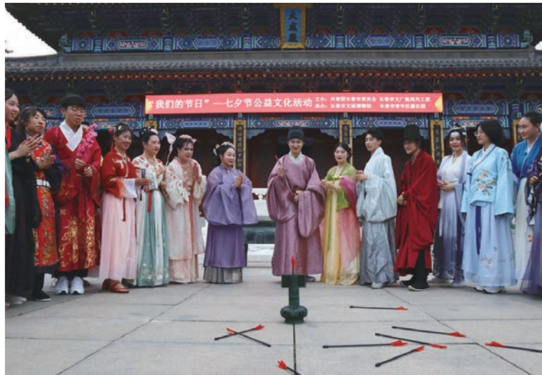
2022年长春市文庙博物馆开展“我们的节日”七夕公益文化活动现场

人能弘道,非道弘人。十年来,长春市文庙博物馆以党建为引领,不断奋斗进取,创新创造,不忘本来、吸收外来、面向未来,各项业务工作取得了长足的进步。通过对孔子学说、儒家思想为主的优秀传统文化资源进行深入挖掘整理,并将研究成果转化为主题教育和群众性公益文化活动,普及了优秀传统文化知识,增强民族自信心和自豪感,收到良好效果。对于展示文明单位形象,汲取中国智慧,弘扬中国精神,推动中华优秀传统文化创造性转化和创新性发展进行了有益尝试,让更多人了解中华优秀传统文化,共享改革开放发展成果。