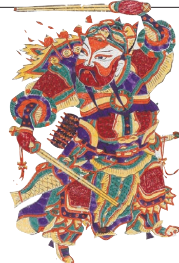
《步下鞭》 每幅38×27厘米(一对) 近代 朱仙镇年画 开封市博物馆藏

2023年1月10日，受广东省博物馆之邀，300余件来自河北武强、天津杨柳青、潍坊杨家埠、河南朱仙镇、苏州桃花坞、四川绵竹、广东佛山等地的特色年画藏品走出当地的博物馆、美术馆，云集“年画里的中国”展览，为观众带来吉祥喜庆的美好祝愿。这是第一个汇集年画之大观的展览，第一个汇集年画各流派的展览，也是第一个汇集年画收藏博物馆参展的展览，将文物藏品和非遗传承相结合，全面展示了蔚为大观的年画艺术。 年画具有鲜明的地域性，从产地上来看，除了青海、内蒙古、新疆等个别省份外，全国各地都有自己风格特色的年画。在展厅的开篇部分，就展出了佛山、绵竹、桃花坞、朱仙镇、杨家埠、杨柳青、武强等多地的印版、线稿与色稿，通过比较可以明显地看出各年画产地制作年画审美的差异。北方年画比较有代表性的如山东省杨家埠年画和河北省武强年画，画面构图饱满，色彩明快，线条粗犷，题材广泛，有着强烈的地方特色和浓郁的乡土气息。而南方年画比较有代表性的如江苏省桃花坞年画和广东省佛山年画，画面色彩轻盈、文质沉雅，细腻柔美，人物造型简练概括。