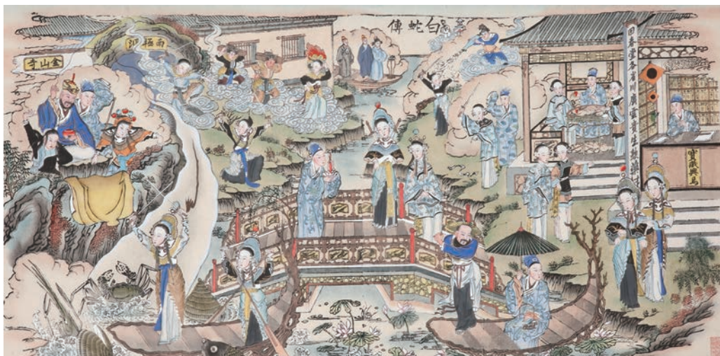
《白蛇传》59.5×106.5厘米 年代不详 杨柳青年画 天津博物馆藏

由于地理环境和风俗民情的差异，即使是北方生产的年画也有各自的艺术特征和审美追求。杨柳青年画出自于天津杨柳青镇及其周边村庄，兴于明，盛于清。“戴廉增”“齐健隆”画店都是当时著名的画店。清代中晚期，一些职业画师的介入，使得杨柳青年画吸收了不少文人画的创作特点，描画细致，渐趋清雅与华美，与北方年画豪放、雄浑的绘画风格已经大相径