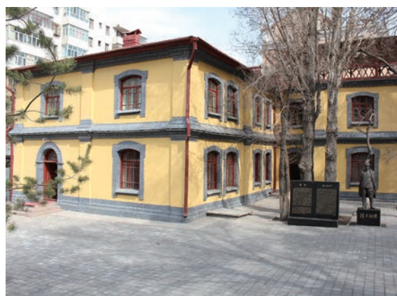
八路军驻新疆办事处旧址外景

地上进行艰苦卓绝浴血斗争的历史见证。八路军驻新疆办事处旧址虽然名义上只是八路军在新疆的一个办事处，实际上它却是中国共产党在新疆的联络指挥中心。它的重要作用是在其使用期间，保持了一条中国共产党和苏联之间的物资和人员往来的输送通道，能够有效地将苏联的援助物资转运于延安，同时也能更方便地接济往来于莫斯科和延安之间的中共干部，保持了新疆与中共中央的紧密联系。它领导着中国工农红军西路军左支队(新兵营)的训练和学习，领导在新疆工作的共产党员动员新疆各族人民开展抗日救亡运动，通过发动群众为八路军抗日筹集物资，治疗和管理在迪化养病的八路军伤员，推动和促进了新疆政治、经济、教育、文化事业的发展。