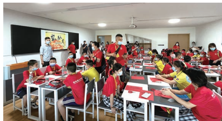
2022豫哈青少年夏令营活动

自2019年开馆，二里头夏都遗址博物馆研学(以下简称“夏博研学”)已悄然开始，从“根在河洛一探寻最早的中国”公益研学行、“大黄河研(游)学旅行”启动，到海外华裔寻根之旅研学冬令营等，夏博研学活动方兴未艾，令人目不暇接。