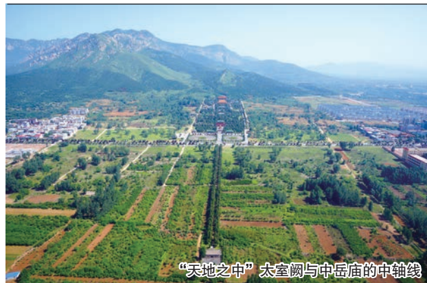
“天地之中”太室阙与中岳庙的中轴线