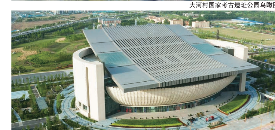
大河村国家考古遗址公园鸟瞰图