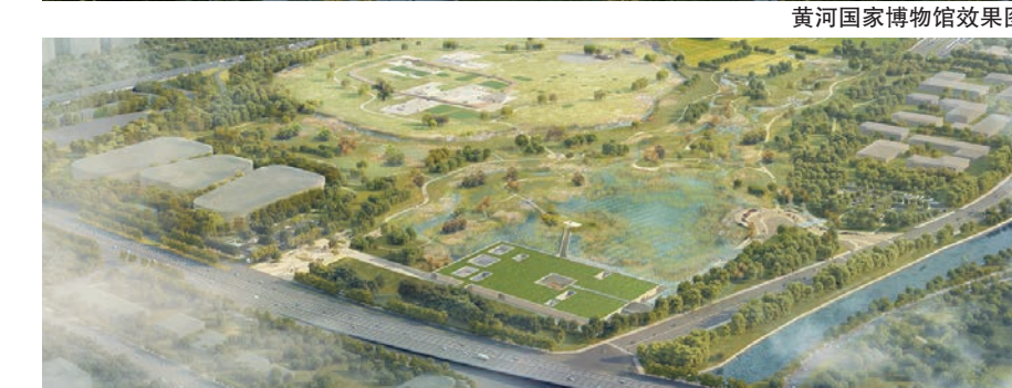
黄河国家博物馆效果图