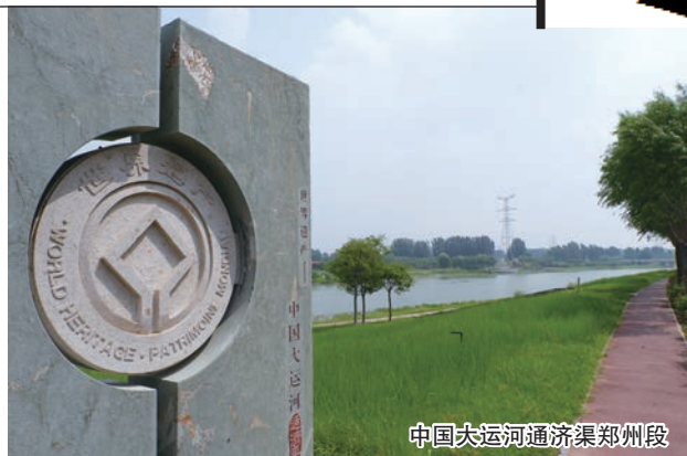
中国大运河通济渠郑州段