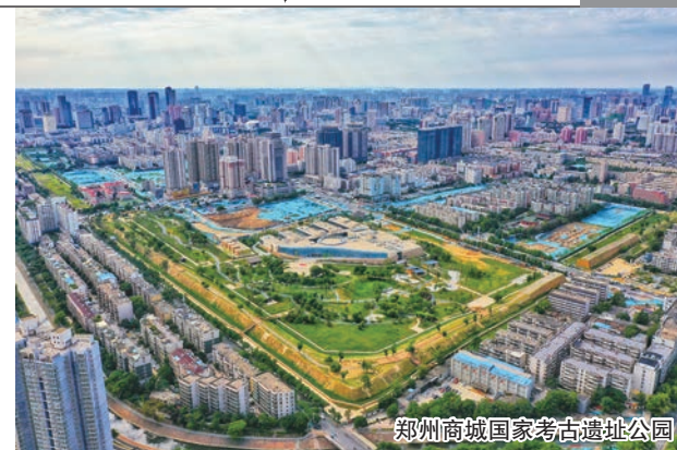
郑州商城国家考古遗址公园