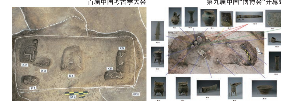
2022年“考古中国”重大项目:郑州书院街商代贵族墓区考古发现M2底部殉狗坑及M2器物位置