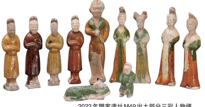
2022年樊家遗址M49出土部分三彩人物俑

十年来,济南市考古研究院主动作为,迎难而上,围绕济南、服务全省,积极配合各项工程开展考古工作,取得了一系列重大成绩,一大批重要发现涌现出来,考古工作进入了高质量发展阶段。这一阶段发掘的“济南市柳埠镇神通寺遗址”“章丘牛推官南遗址”分别获得2013-2015、2018-2019年度“山东省优秀田野考古工地奖”;“历城梁二战国墓”“天桥药山汉墓”“济阳三官庙汉墓”“济南元代郭氏家族墓地”等先后被评为2016、2017、2019、2021年度“山东省五大考古新发现”,数量位居省内各地市第一。同时,加大了文物修复力度,着力拓展考古成果展示传播水平,提升考古阐释研究能力,大大丰富了市民的文化生活,起到了守护济南文脉,传承济南文明的作用。大量的考古成果,延伸了历史轴线,增强了历史自信,丰富了历史内涵,活化了历史场景,扩大了济南文化影响力。济南考古进入了一个新的发展时代。