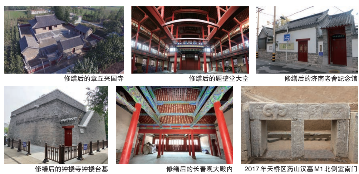
修缮后的章丘兴国寺 修缮后的题壁堂大堂 修缮后的济南老舍纪念馆 修缮后的钟楼寺钟楼台基 修缮后的长春观大殿内 2017年天桥区药山汉墓M1北侧室南门

东省第一个考古前置政策的落地实施。在工作过程中,济南市考古研究院积极探索改进调查勘探方式,针对不同情况采取不同的措施,与建设单位积极沟通协商,推动了各个项目的落地实施,推出一条国有土地出让中适合济南实际的考古前置“调查+勘探”的新模式,得到山东省文化和旅游厅的肯定,被《光明日报》《中国文物报》等媒体宣传报道,也为省内兄弟城市考古前置政策的实施探索了道路,积累了经验,提供了借鉴。