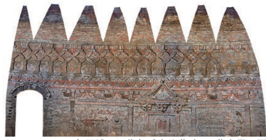
2021年历城区元代郭氏家族墓地M8墓室展开图