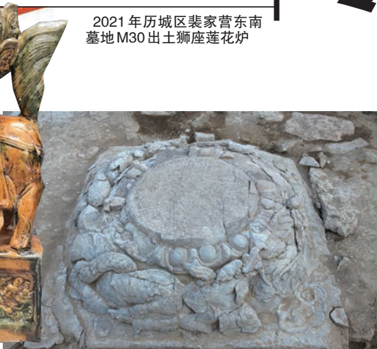
2021年历城区裴家营东南墓地M30出土狮座莲花炉

一系列的考古工作,既有力配合了工程建设的顺利开展,促进了经济建设,又抢救性保护了大量珍贵文物,彰显出历史文化名城济南的深厚文化底蕴。同时,济南市考古研究院还注重采用现代科学技术提取保留墓葬信息,如凤凰路赵家庄墓地、济阳三官庙汉墓、元代郭氏家族墓地等采用三维扫描,高新区清代壁画墓、济阳前刘唐墓、三官庙汉墓等的整体搬迁、原址保护方式达到山东省内最高水平,丰富拓展了文化遗产保护的方法与内容。