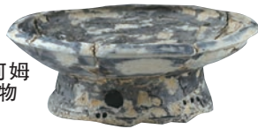
顾家庄遗址河姆渡文化晚期器物

2022年,宁波地区共开展考古调查65项、勘探31项、发掘10项,主持完成主动性考古项目——2022年度奉化江流域先秦遗址考古调查与勘探,合作开展主动性科研项目——宁波地区海岸线变迁及人地关系研究。其中,奉化顾家庄遗址入选2022年度“浙江考古重要发现”,余姚井头山遗址二期、余姚江桥头遗址、余姚堰头山墓地、江北竹山湾遗址、镇海汶溪遗址、奉化陈王遗址等项目的发掘工作仍进行中。现将年代早晚将其中四个发掘项目和两个主动性项目择要介绍如下: