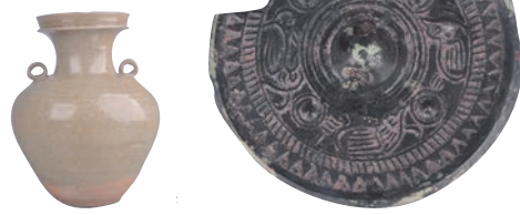
孟夹岙墓地主要出土器物

2022年,宁波地区共开展考古调查65项、勘探31项、发掘10项,主持完成主动性考古项目——2022年度奉化江流域先秦遗址考古调查与勘探,合作开展主动性科研项目——宁波地区海岸线变迁及人地关系研究。其中,奉化顾家庄遗址入选2022年度“浙江考古重要发现”,余姚井头山遗址二期、余姚江桥头遗址、余姚堰头山墓地、江北竹山湾遗址、镇海汶溪遗址、奉化陈王遗址等项目的发掘工作仍进行中。现将年代早晚将其中四个发掘项目和两个主动性项目择要介绍如下: