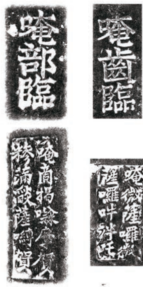
图一 模印佛教经文