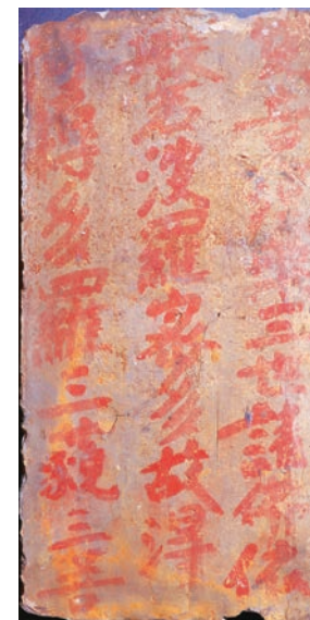
图三 朱书《般若波罗蜜多心经》铭文