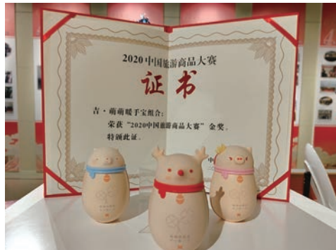
文创产品萌萌暖手宝组合获中国旅游商品大赛金奖