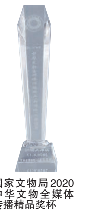
国家文物局2020中华文物全媒体传播精品奖杯