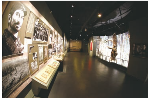
黑土军魂——东北抗日联军军史陈列