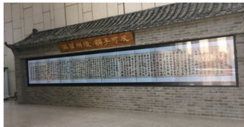
多人互动文物展示幕墙