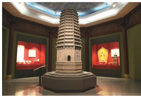
白山松水的记忆——吉林省历史文化陈列

开展吉林省公共文化服务平台建设,打造了一个服务于社会公众、全吉林省文物管理部门和博物馆的公共文化服务平台,完成省内62家博物馆66项展陈的全景或三维制作、展示,编辑文物故事20个、动漫短片8个。完成多人互动文物展示幕墙安装,有效增加观众的互动性和参与性;建立文物智慧化综合业务管理系统,包括藏品管理、库房可视化、展陈管理、社教管理、文创管理、志愿者管理、预约与观众接待服务等模块和统一支撑平台的建设,确保资源有效整合,更好地服务于社会公众;推出了多个线上展览,包括基于实体展览的全景展示和H5系列原创微展览,有效延伸了博物馆社会教育服务的链条,弥补了实体展览时间和空间的限制,其中H5系列原创微展览入围国家文物局2020年度中华文物全媒体传播精品(新媒体)、“春节雅事——书画茶香二三事”微展览被文化和旅游部选中在2021年春节假期在海外推送;丰富新媒体传播方式,官网、吉林省数字博物馆在线服务平台、微博、微信等多种新媒体“同频共振”;加强基础数据库建设,完成3万余册古籍图书数据采集工作,开展老照片、老录像、历史文献的数字化采集和科学化管理。