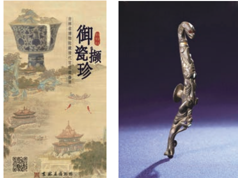
御瓷撷珍 H5 展览 汉错金银“丙午神钩”铜带钩