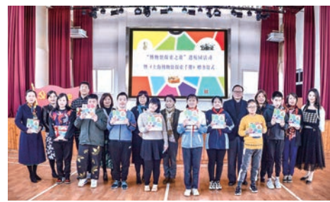
《上海博物馆无障碍探索手册》赠书仪式