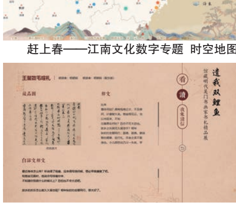
赶上春——江南文化数字专题 时空地图

内容为王，更大的容量、更深的层次、更灵活的架构，这是博物馆线上展示策划的主要特点。但是在具体的实施过程中，亦需要根据内容的需要和观众的使用体验进行更为精细的调整。