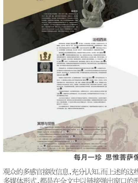
每月一珍 思维菩萨像

正如实体展示中静默的实物会令观众苦于信息的不完整，线上展示的信息过载也会带来理解的困惑。面对海量的信息，观众往往无法明确找到清晰的逻辑。这就需要合理地选择展示的方式，准确的信息分类和更多的信息关联，能够帮助观众更好地理解展示的逻辑。2018年上海博物馆推出的“丹青宝筏——董其昌书画艺术大展”数字专题中，引入数字人文的展示方法，基于大数据搜集和分析来组织和呈现信息，以一种“可阅读”的方式传播给观众，使他们在浩如烟海的信息流中准确领会到策展方意图。在董其昌生平专题中，以可视化列表的形式将董氏82年的人生经历逐年开列，并汇集其纪年作品数据形成曲线相参照，详细地展现了董氏求学、仕官和艺术创作的历程，反映了个人经历与其艺术的关系。同时在这张年表中容纳了董氏所生活年代的重大历史事件和文化艺术事件，试图以一种更为广阔的视野考察社会环境和文化思潮对董其昌艺术理念及创作的影响。这张年表还罗列了同时期欧洲历史与文艺的重大事件，将中国艺术史置于整个世界艺术史的框架中予以观照，比较同一时代不同文明社会制度、文化走向与艺术发展的不同理念和方式，希望观众由比较中发现中国艺术乃至文化的独特性及其在世界历史中不可或缺的地位。