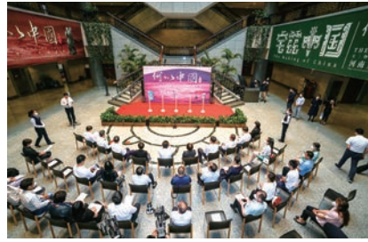
2022年“宅兹中国:河南夏商周三代文明展”开幕式