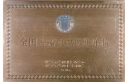
全国古籍保护重点单位