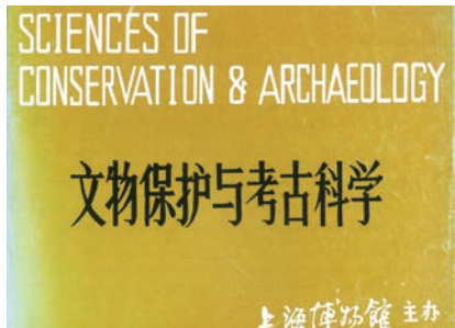
《文物保护与考古科学》1989年创刊号