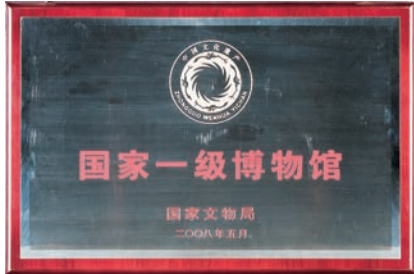
国家一级博物馆奖牌