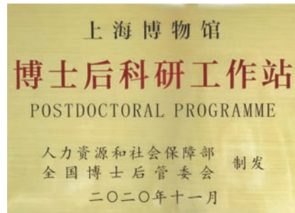
上海博物馆博士后科研工作站成立