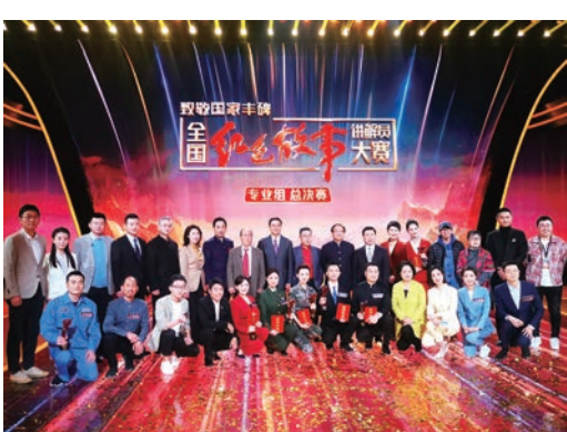
荣获“全国红色故事讲解员大赛”金牌