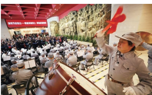
举办“清明节的铭记”活动

加强联络沟通,促进交流合作。先后召开20余次协会专题会议、高级别论坛、国际学术研讨会等,联合举办“二战抗日战场”国际展览、“中国抗战漫画”专题展、“前线”画家谢尔盖·卡特科夫眼中的战争、“患难见真情——二战时期救助犹太人的波兰人”等系列展览。其中,在美国旧金山举办“事实与真相——二战时期发生在亚太地区的罪行”专题展览,深刻揭露日本军国主义在亚太地区的反人类、反和平罪行,得到国际社会的广泛认同。