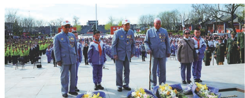
举办“清明节的铭记”活动