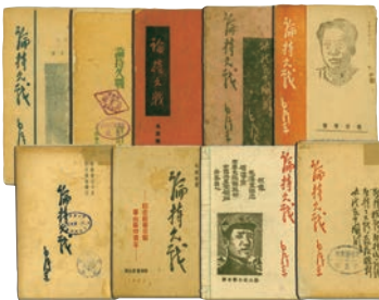
抗战时期发行的《论持久战》各种版本

精心组织,中国人民抗日战争纪念馆多次承办国家抗战纪念活动。党的十八大以来,以习近平同志为核心的党中央高度重视抗日战争纪念、研究和宣传,以立法形式确定重要抗战纪念节点,并对系列国家抗战纪念活动做出规范。抗战馆作为纪念仪式举办场所和直接承办单位,在中央和市委有关部门领导下,牢固树立政治意识,自觉强化阵地责任,主动对接相关保障单位,先后圆满完成以纪念全民族抗战爆发77、78、80、85周年仪式和纪念中国人民抗日战争暨世界反法西斯战争胜利69、75周年向抗战烈士敬献花篮等国家级抗战纪念活动。