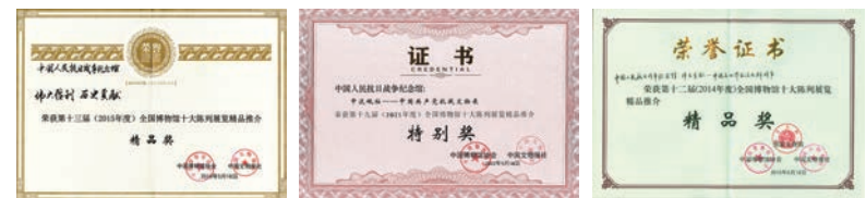
荣获全国博物馆十大陈列展览精品推介特别奖、精品奖