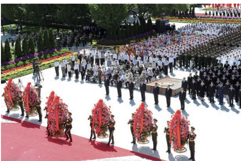
党和国家领导人与首都各界代表一起向抗战烈士敬献花篮