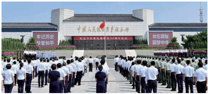
纪念“全民族抗战爆发”仪式

中国人民抗日战争纪念馆作为全民族抗战爆发地和全国唯一一座全面反映中国人民伟大抗日战争历史的大型综合性专题纪念馆,深入学习领会总书记重要论述,始终秉承建馆之初中央赋予的“爱国主义教育基地、抗日战争史料收集和研究中心、对外民间交流的窗口和联系港澳台同胞以及海外侨胞的桥梁”三大任务,通过承办国家级重大抗战纪念活动、举办高品质主题展览、推出爱国主义教育品牌、加强抗战史国际交流传播等,以史育人培根铸魂,讲好中国抗战故事,为实现中华民族伟大复兴凝聚强大的精神力量。