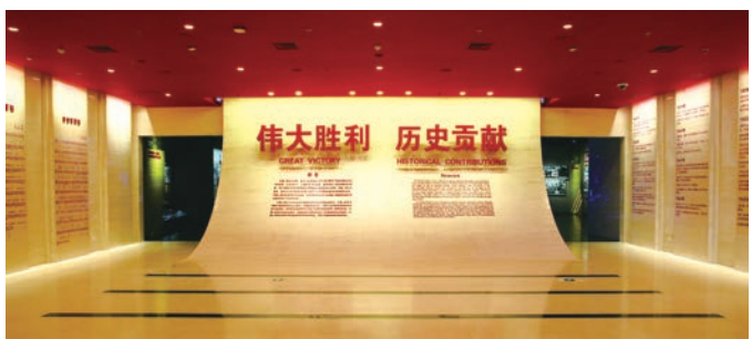
“伟大胜利 历史贡献”基本陈列

围绕基本陈列开展抗战历史及抗战精神总体研究,围绕专题展览开展中国共产党中流砥柱作用、中国共产党领导的敌后抗战、中国抗战的东方主战场地位及对世界反法西斯战争的历史贡献、抗战文物及纪念馆展陈等专题研究。在《光明日报》《中国文物报》《人民政协报》《北京日报》《前线》等重要报刊发表学术文章50余篇。围绕宛平城卢沟桥周边地区的七七抗战遗址遗迹调查、通州事件史实调研、七七事变与京津冀地区日本居留民、北平文化界与抗战、台湾少数民族抗日斗争与中华民族认同研究、北京抗日战争志·军事卷等社科规划项目开展课题研究,推动学术研究成果转化、深入化。联合出版《日本侵华密电·七七事变》《日本侵华密电·侵占台湾》《日本侵华密电·最高决策》等多部丛书。