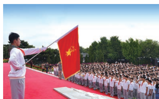
开展演讲、朗诵、宣誓等少先队主题活动