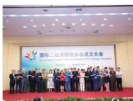
成立国际二战博物馆协会