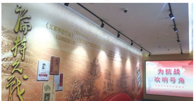
“为抗战吹响号角——中国共产党领导的抗战文化”专题展