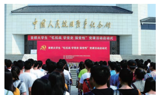
举办首都大学生“忆抗战 学党史 强党性”党课活动