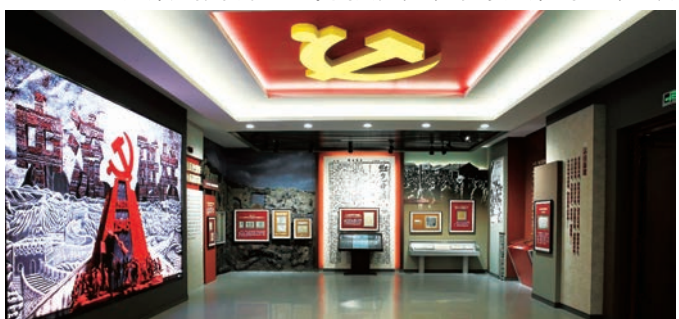
“中流砥柱——中国共产党抗战文物展”专题展