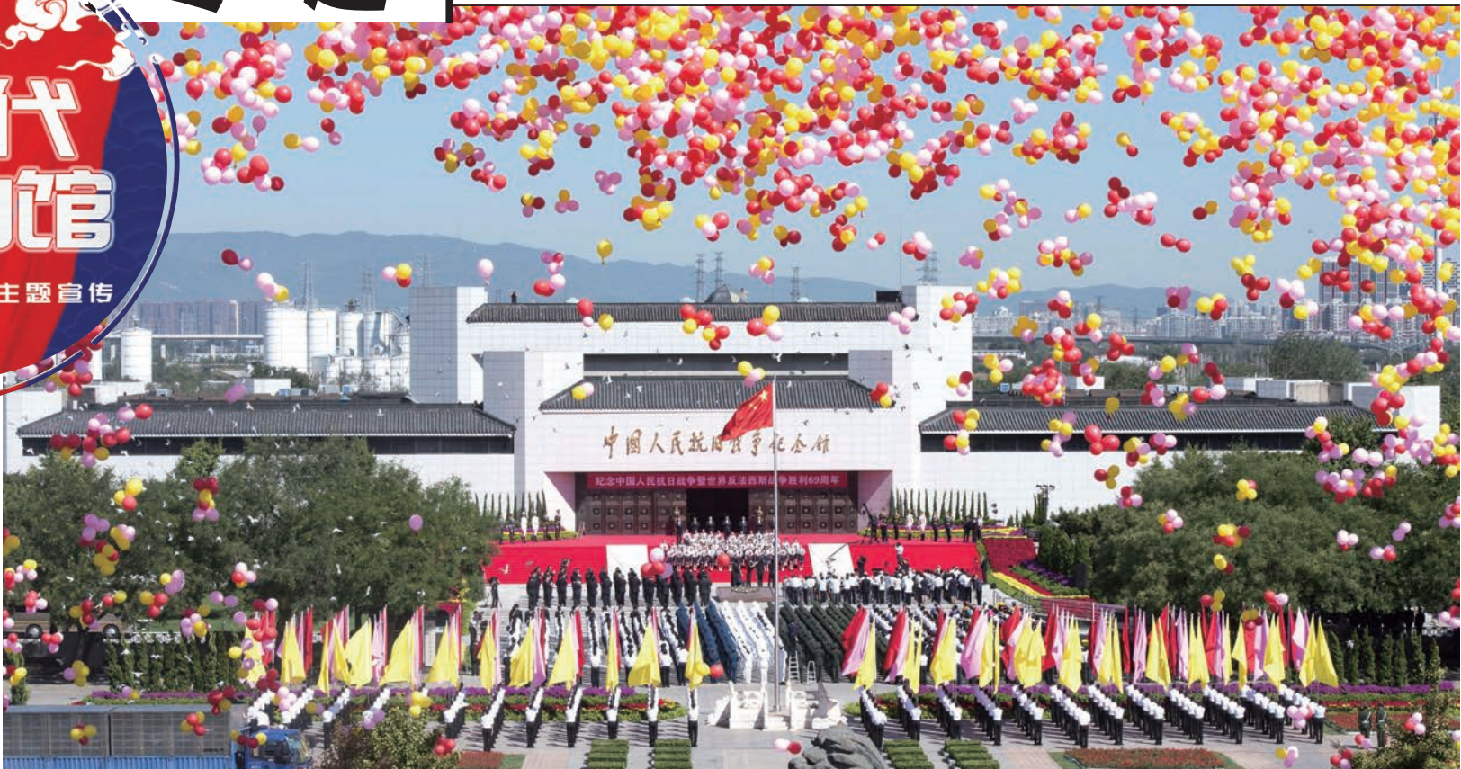
国家纪念中国人民抗日战争胜利和全民族抗战爆发活动中心