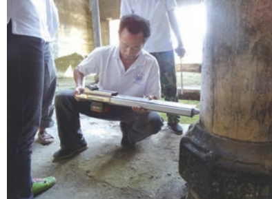
革命旧址无损检测木柱内部病变