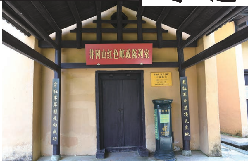
革命旧址专题陈列展览

二是精心打造专题展览,扩大革命文化影响力。着力打造井冈山革命博物馆和井冈山会师纪念馆基本陈列。井冈山革命博物馆基本陈列按“见人、见事、见物,更要见精神”的原则,采用“红色经典,现代表述”的总体设计理念,通过现代化的展示手段和丰富的表现形式,再现了1927年10月至1930年2月井冈山斗争两年四个月血与火的辉煌历史。