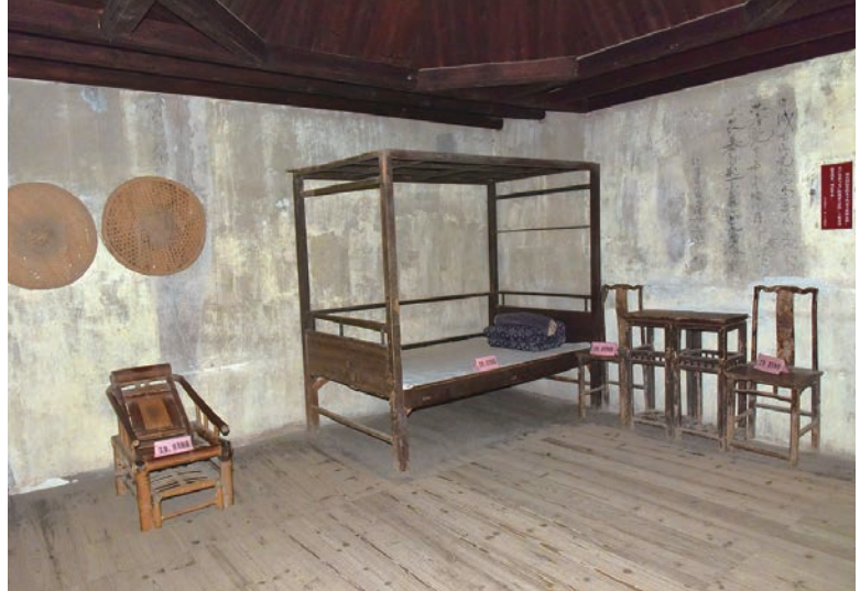
革命旧址场景原状陈列