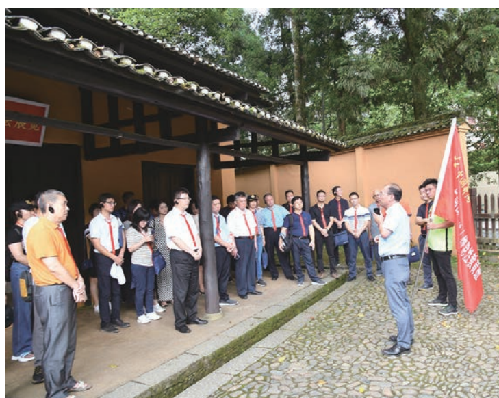
革命旧址现场教学

三是展览渠道多样化,展示传播有深度。井冈山将红色文化宣传从山上往山下延伸,从高速公路到茨坪核心景区,沿途打造了雕塑长廊,有“旗、火、魂、号、山、炬”等大型雕塑展示,2021年新建了“井冈之路”智慧照明系统。除此之外,井冈山将宣传工作拓展到“海陆空”,在“井冈山舰”上布设“井冈山精神展”,在井冈山机场增设“红绿辉映井冈山”展示长廊,在南昌地铁2号线上和北京至井冈山动车上打造“百年党史江西篇”主题专列“中国革命的摇篮井冈山”展。这些均生动展现了中国共产党百年奋斗的光辉历程、伟大贡献以及井冈山精神的丰富内涵,为开展党史学习教育、庆祝中国共产党成立100周年、庆祝党的二十大召开、庆祝井冈山革命根据地创建95周年营造了浓厚氛围。