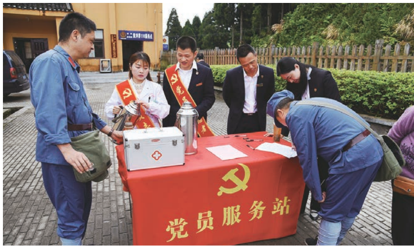
革命旧址党员服务站

之前,按照江西省文旅厅“关于做好红色标语普查和保护利用专项工作的通知”和“关于印发《江西省红色标语保护利用试点工作方案》的通知”要求,编制了《江西省井冈山山市拿山红军标语保护施工方案》和《江西省井冈山会师纪念馆红军标语保护保养方案》,并实施了红色标语技术保护工程。2021年3月被评为江西省红色标语保护利用优秀工作案例,行洲和黄泥红色标语被评为“江西省十大红色标语示范展示点”,促使井冈山革命文物整体性保护和有效性利用得到全面提升。