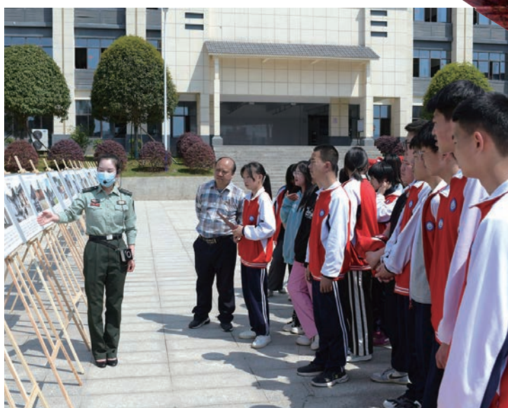
革命旧址展览进校园