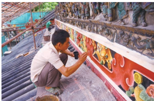
佛山祖庙修缮工程——三门灰塑修复

佛山市祖庙博物馆现有修复场地1483.62平方米，包括文博科研究室、书画修复室、陶器修复室和木器修复基地，配备各种文保专用设备20余台。2017年、2020年博物馆相继取得了广东省文物局颁发的竹木雕、家具、木、陶器四大类可移动文物修复资质，培养了十余名优秀文物修复专业技术人员，配套建设了科研实验室、书画修复室、陶器修复室、竹木器修复基地等专业场所，按照行业规范配置了文物修复专用设备。目前，该博物馆是佛山市唯一取得可移动文