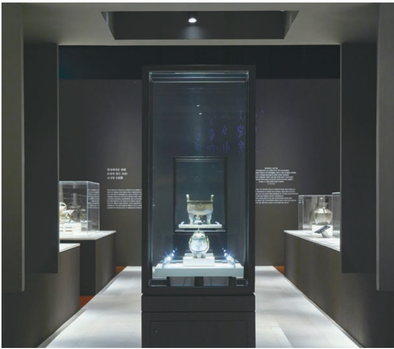
“中国古代青铜文明”展厅

2021年11月29日,在完成外箱消杀、静置隔离后,所有赴韩国“中国古代青铜文明”展览的68件(组)展品经工作人员仔细查验,妥善归库。虽然展览已在两周前顺利闭幕,但对于博物馆人来说,文物安全回家展览才算真正圆满结束。虽然在新冠肺炎疫情期间筹备出境展览历经波折,但上海博物馆不忘推动中华文化走出去、讲好中国故事的初心与使命,在困难中勇毅前行,积极作为。