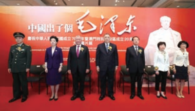
“中国出了个毛泽东”——庆祝中华人民共和国成立70周年暨澳门特别行政区成立20周年大型图片展