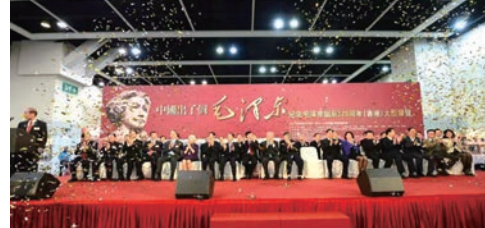
“中国出了个毛泽东”——纪念毛泽东诞辰120周年(香港)大型展览