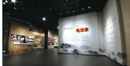
基本陈列“中国出了个毛泽东”