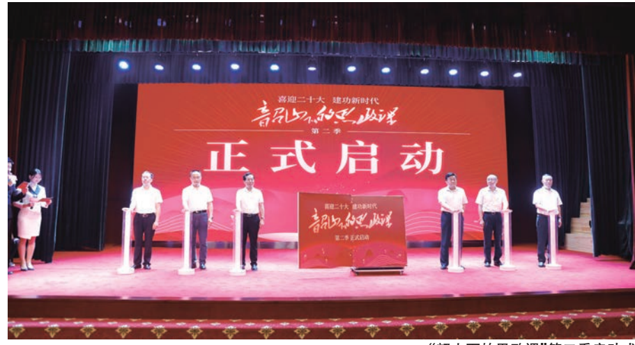
“韶山下的思政课”第二季启动式