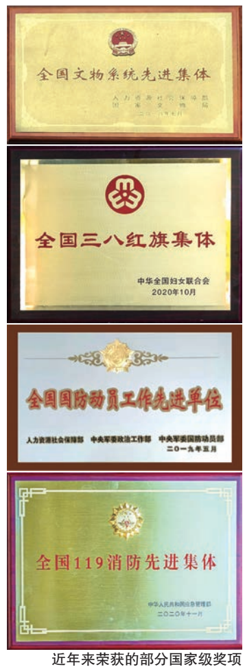
近年来荣获的部分国家级奖项