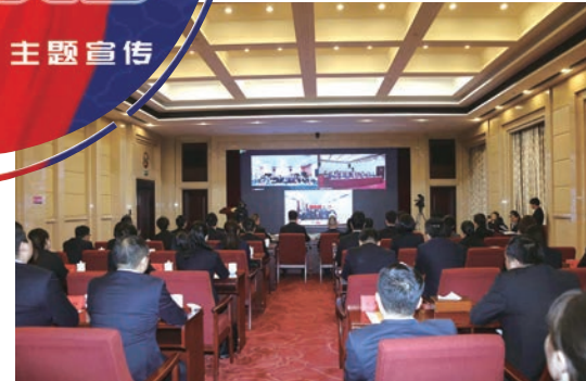
与中国驻瑞士联邦大使馆、湖南师范大学开展云端联学联建专题活动

延伸宣传教育阵地。一是创设新媒体教育平台,形成教育矩阵,馆内相继开设了韶山毛泽东同志纪念馆网站、微信公众号、微信视频号、抖音号等宣传平台,定期推送教育视频、资讯等;二是着力打造文创教育品牌,作为全国92家文创改革试点单位之一,韶山毛泽东同志纪念馆积极推动馆藏红色文物的创新性转化,文创产品涉及馆藏衍生品、仿复制精品、创意产品等多种类型,涵盖馆藏仿真、主题元素、贵金属、塑像、瓷器、车饰、服装配饰、文化出版物和其他产品九大类,500余种,多次获得国家级和省级奖项;三是总结文创工作经验,形成研究成果,为博物馆文创发展提供了可借鉴的素材。韶山毛泽东同志纪念馆文创通过13年的探索与实践,逐渐走出了一条独具韶山地域特色、满足观众需求、推动事业发展的新路子。