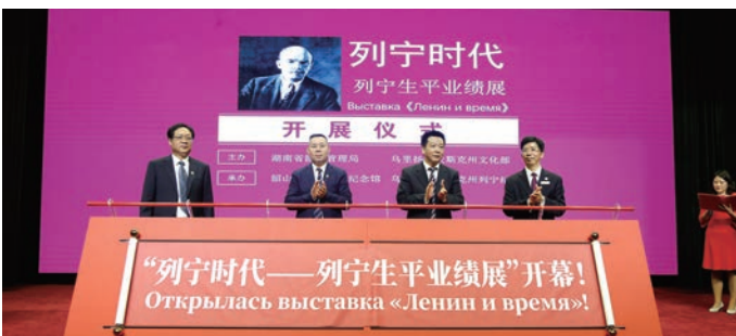
“列宁时代——列宁生平业绩展”开幕式