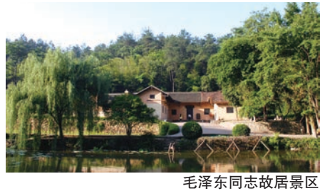
毛泽东同志故居景区

韶山毛泽东同志纪念馆是系统展示毛泽东主席生平业绩、思想和人格风范的纪念性专题博物馆,同时也是全国优秀爱国主义教育示范基地、全国廉政教育基地、国家一级博物馆、全国博物馆文化创意产品开发试点单位、首批全国中小学研学实践教育基地、首批“大思政课”实践教学基地。近十年来,接待国内外观众2000余万人次,其中党和国家领导人及社会著名人士100余位,外国国家领导人和政党领袖50余位,观众接待量居同类馆前列。