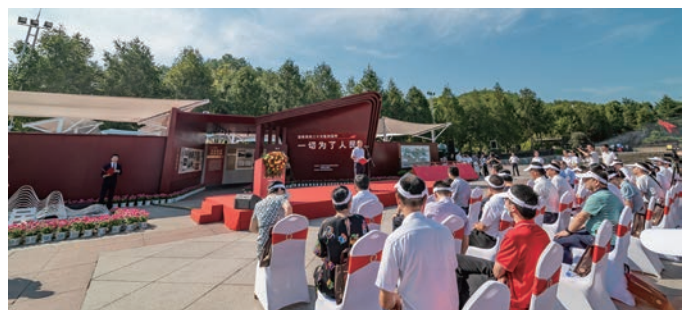
“一切为了人民——迎接党的二十大胜利召开”主题展开幕式