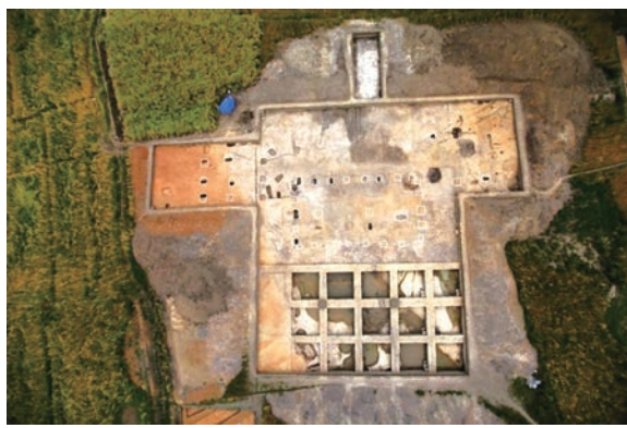
宝墩遗址大型建筑基址