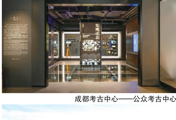
成都考古中心——公众考古中心