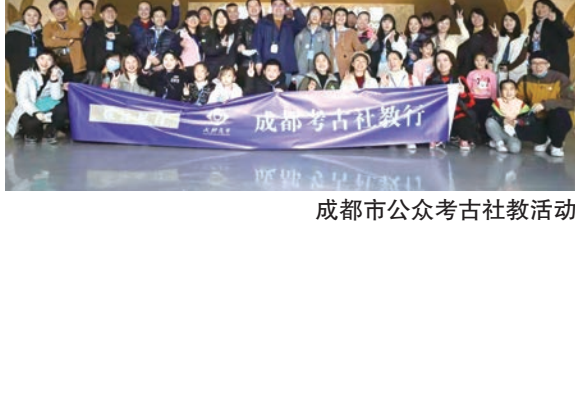
成都市公众考古社教活动