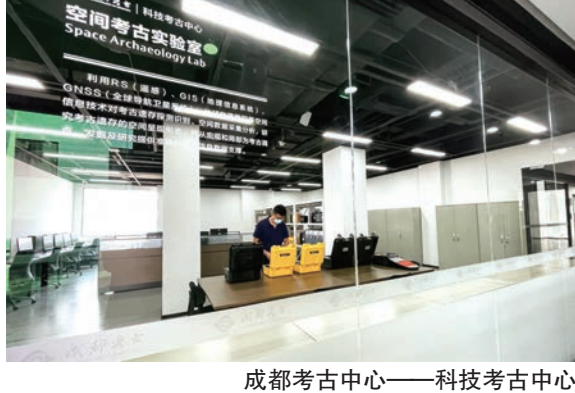
成都考古中心——科技考古中心