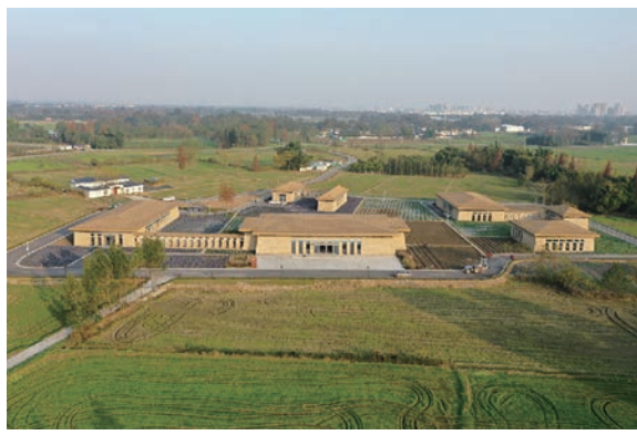
宝墩遗址考古工作站