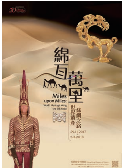
“绵亘万里——世界遗产丝绸之路”