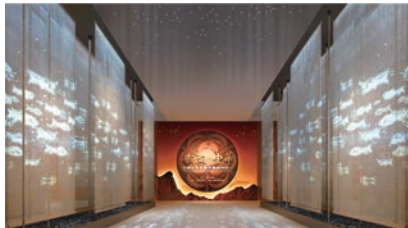
“彩陶·中华——中国五千年前的融合与统一”