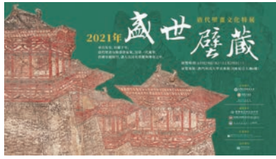
“盛世壁藏——唐代壁画文化特展”