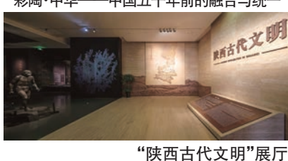
“陕西古代文明”展厅