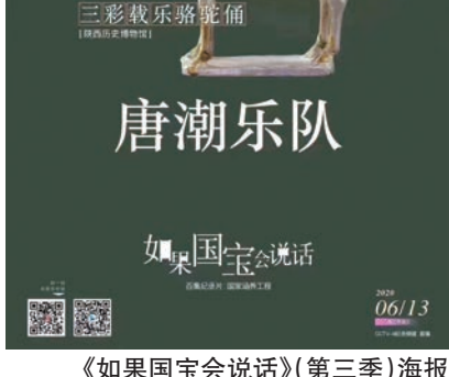
《如果国宝会说话(第三季)海报》