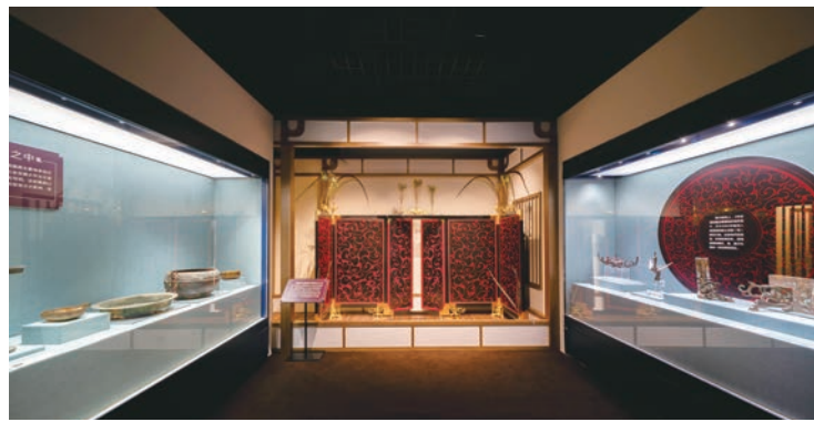
“大海就在那里”中国古代航海文物大展