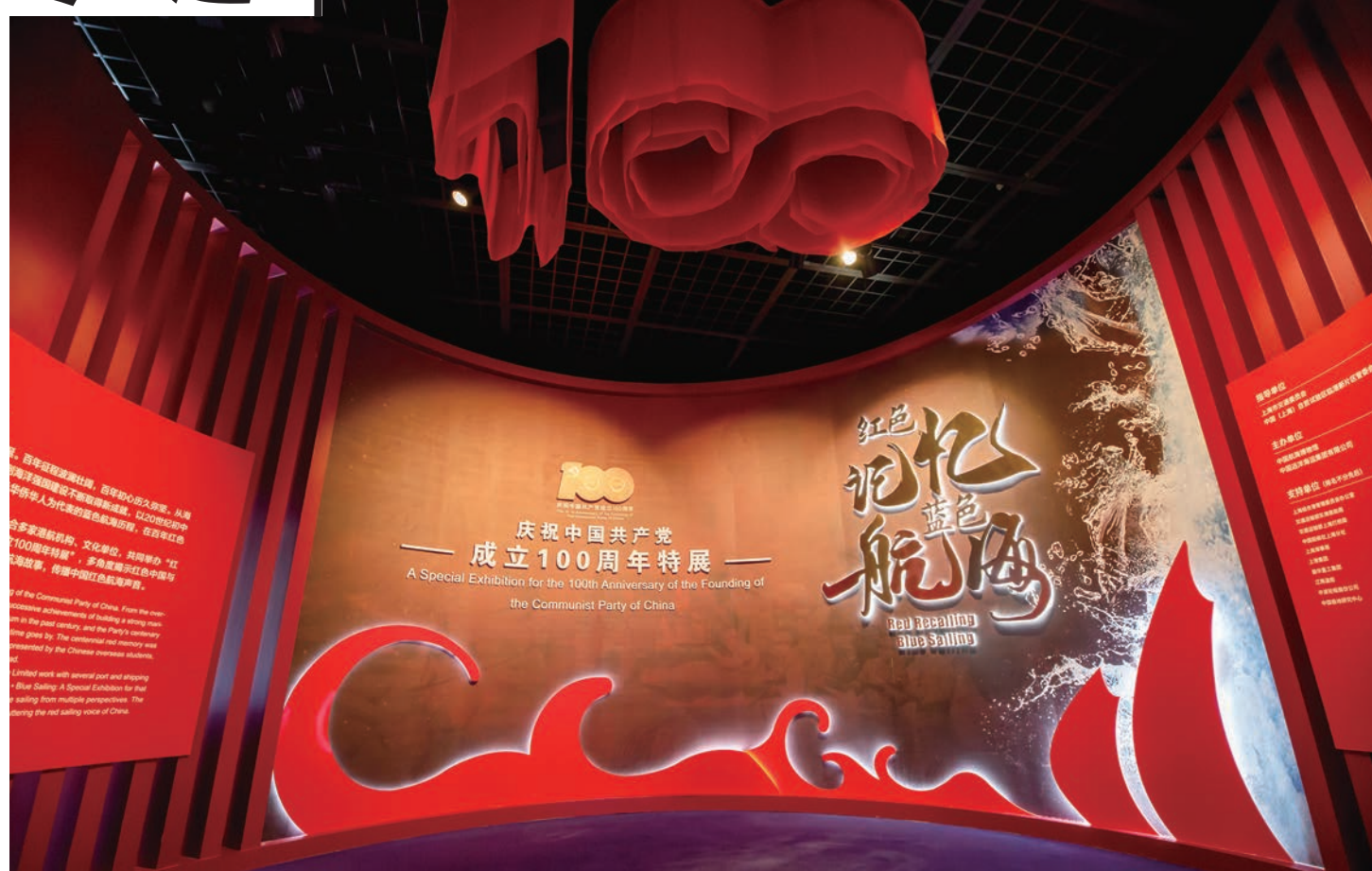
红色记忆·蓝色航海:庆祝中国共产党成立100周年特展

近年来,中海博聚焦“一带一路”倡议、“海洋强国”战略、文化文博事业发展,增强贯彻落实的自觉性和坚定性,以更高的站位、更远的眼光、更宽的视野、更实的举措,发挥博物馆在新时代应有的功能和作用。2020年,相继获国家一级博物馆、全国文明单位荣誉。