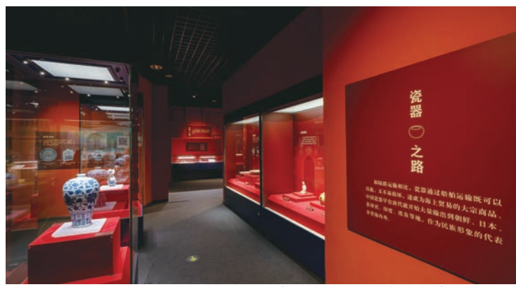
大海就在那里:中国古代航海文物大展