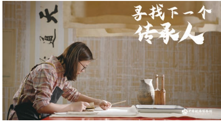
“大海就在那里”中国古代航海文物大展