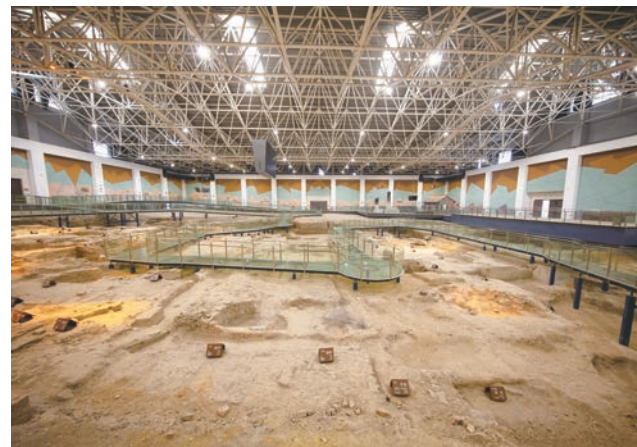
宝丰清凉寺汝官窑遗址展示馆内部场景