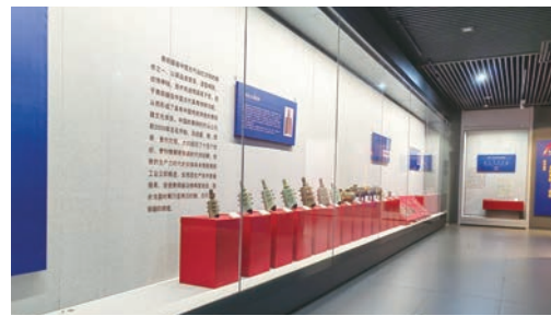
“鹰飞锦拾——平顶山博物馆开馆十周年文物征集成果展”展厅