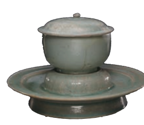
汝窑天青釉瓷盖与盖托