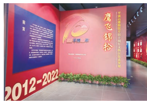
“鹰飞锦拾——平顶山博物馆开馆十周年文物征集成果展”展厅