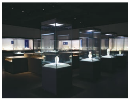
宝丰汝窑博物馆展厅陈列