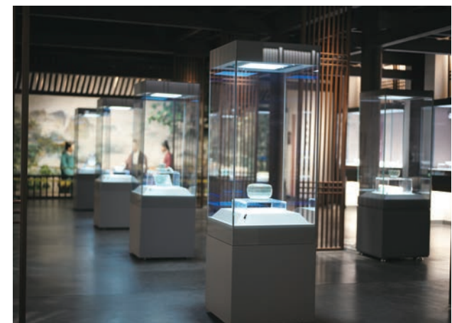
宝丰汝窑博物馆“青瓷典范”展厅