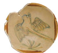
铜官窑2016年度出土与黑石号同款式瓷器

党的十八大以来,湖南考古工作者认真贯彻落实习近平总书记关于考古工作的重要论述和重要批示精神,不断探索未知、揭示本源,取得一系列重要考古成果。先后参与“中华文明探源工程”和“考古中国·长江中游文明进程研究”重大项目;华容七星墩遗址、澧县孙家岗遗址等考古发现在国家文物局“考古中国”重大项目重要进展工作会上公布;泸溪下湾遗址、华容七星墩遗址等项目入围“全国十大考古新发现”初评;益阳兔子山遗址、桂阳桐木岭矿冶遗址、澧县鸡叫城遗址入选“全国十大考古新发现”和“新时代百项考古发现”;道县玉壶岩遗址、澧县城头山遗址、里耶古城遗址、长沙马王堆汉墓入选“百年百大考古发现”。