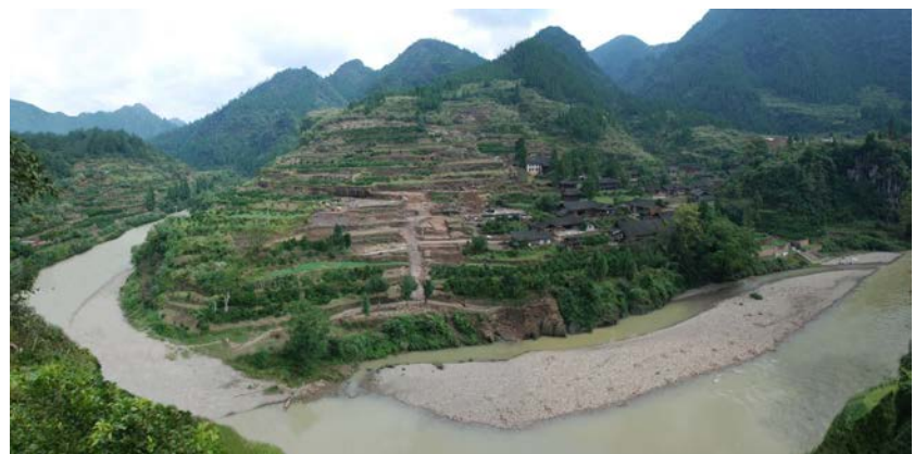
老司城宫城区全景

三是推进东亚现代人类起源与演化项目,重点开展湖南晚更新世旧石器遗址群、史前洞穴遗址的调查、发掘与整理,进一步探讨早期现代人在湖南地区的出现、扩散及其生存适应行为。 四是推进海上丝绸之路研究项目,以长沙窑研究中心为主要依托,积极深入研究长沙窑遗址在海上丝绸之路中的历史地位和作用。 五是推进中外联合考古行动,积极走出去,继续开展中孟、中越考古项目。 六是加大重要考古报告的整理和出版力度,尽快整理出版鸡叫城、七星墩、孙家岗、下湾、李家屋场等重要遗址的考古发掘报告。(执笔:何赞 高成林)