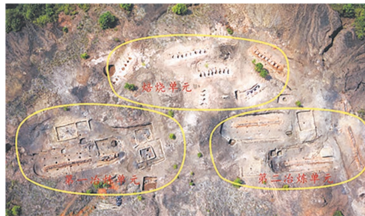
桐木岭遗址功能分区图(由北向南)