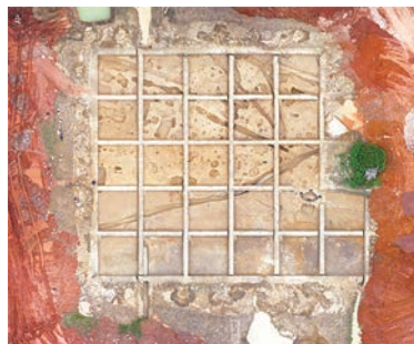
新屋湾遗址西周时期建筑遗迹