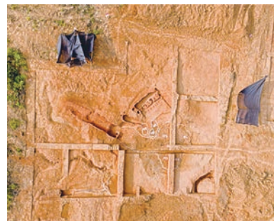
洋塘山汉晋硬陶龙窑