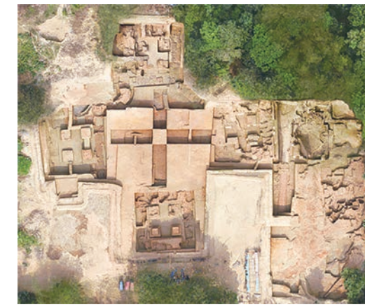
纳提什瓦遗址十字形圣地建筑鸟瞰

及“太阳”“神兽”“神鸟”“神像”等图像。揭示出来的高庙文化晚期遗存,具有浓厚的汤家岗文化因素,是厘清高庙文化与汤家岗文化关系的关键材料。