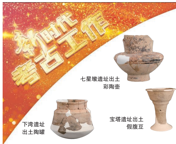
七星墩遗址出土彩陶壶